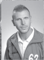
Miklósvári János gyűrő