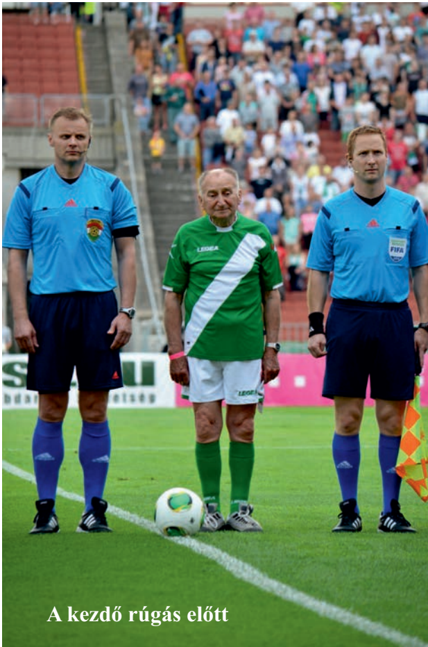
A kezdő rúgás előtt