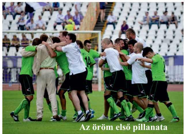
Az öröm első pillanata