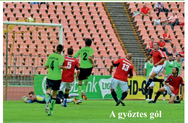
A győztes gól