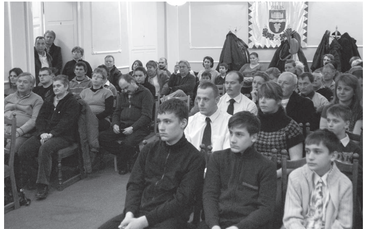
Városunk dísztermében állófogadással egybekötött ünnepséget tartott a győzteseknek