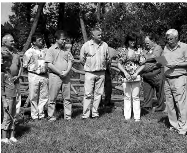
A projekt az Európai Unió támogatásával, az Európai Regionális Fejlesztési Alap társfinanszírozásával valósul meg.

Az érdekl d közönség további részletes, és naprakész információt talál a beruházás menetér l Pilis Város Önkormányzatának honlapján a www.pilis.hu . A beruházás az Új Magyarország Fejlesztési Terv keretein belül a Pro-Régió Közép Magyarországi Regionális Fejlesztési és Szolgáltató Kht. (1146 Budapest, Hermina út. 17, www.proregio.hu) közrem ködésével valósul meg.