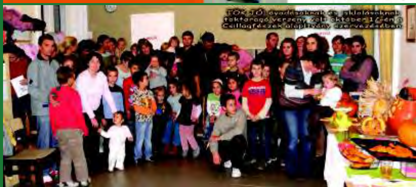
FŐKÖZÖS ÖVÉNYKANDALLÓK ÉS FŰTŐTESTEK TAKTAROLÓVERSENY 2009. OKTÓBER 1-ÉN ÉS 3 CALLIGRÉZSEK ALAPÍTÁNY SZERVEZÉSÉBEN

Figyelem! Kövesse a LXXVIII. Építési törvény változásait a www.pilis.hu hírei között!