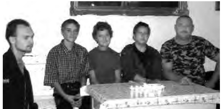
A megemlékezés néhány tagja

A Rózsatanya Hagymány rz Egyesület 2009. október 6-án a Rózsatanyán emlékezett meg a magyar szabadság szentjeir l: a 13 aradi vértanúról és a Pesten 14-ként kivégzett Batthyány Lajosról. A megemlékezés gyermekek és feln ttek 14 mécses