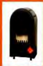
A MINOR BUDÁKÓK

Ingyenes házhoz szállítás 20 km-es körzetben Víz-gáz-központifűtés szerelés, kedvező árral, Ingyenes munkafelméréssel és költségvetés készítéssel.