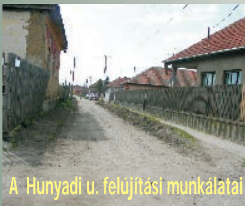
A Hunyadi u. felújítási munkálatai