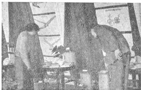
A gyöngyösi kulturházban rendezett könyvkiállítás