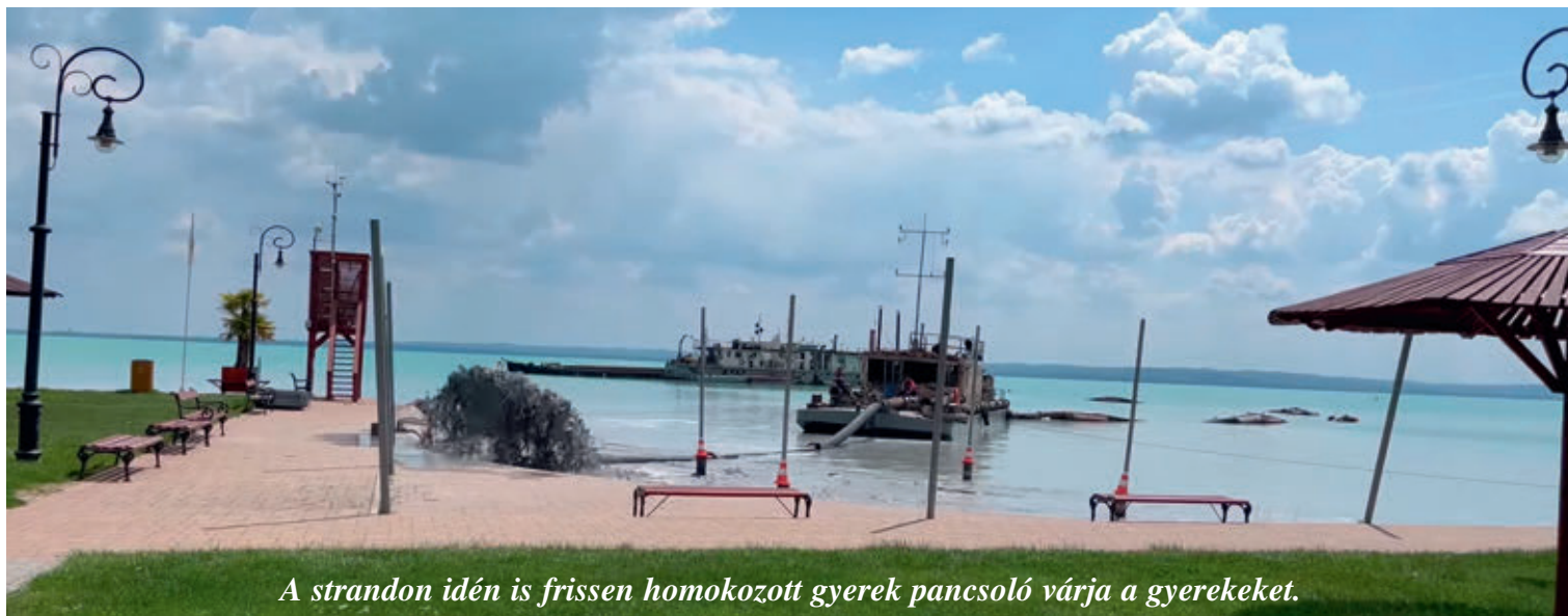
A strandon idén is frissen homokozott gyerek pancsoló várja a gyerekeket.