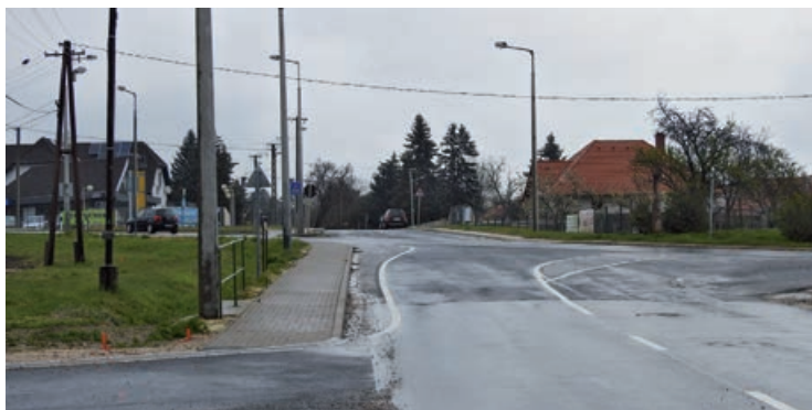
Hamarosan körforgalom segíti a forgalmas csomóponton való áthaladást