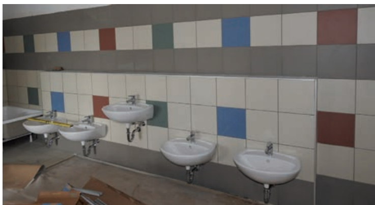
Folyamatban vannak a burkolási munkálatok

Nyár elejére befejeződhetnek bölcsőde építési munkái. jelenleg 75%-os készültségi szinten tart. A nyílászárók beépítése után, már a belső burkolási munkálatok folynak. A berendezések, eszközök beszerzése is folyamatban van.