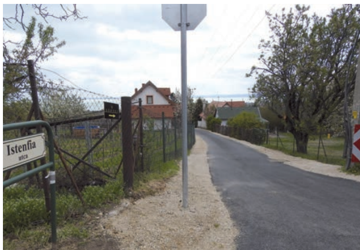
Elkészült az Arany János utca aszfaltozása

A beruházás a Vidékfejlesztési Program, VP6-7.2.1-7.4.1.2-16 kód-számú külterületi helyi közutak fejlesztése pályázat keretében, összesen 20.533.243,-Ft vissza nem térítendő támogatással valósulhatott meg.