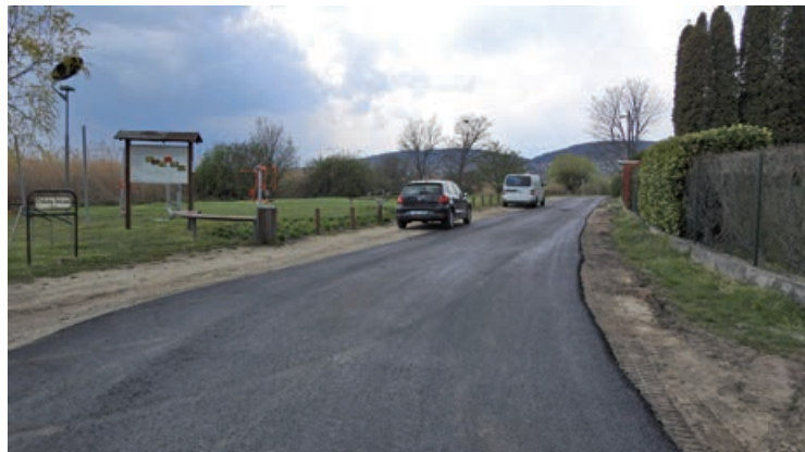
A kerékpárút új nyomvonalának kialakítása is zajlik

A Magyar Állam nevében eljáró Nemzeti Infrastruktúra Fejlesztő Zrt. (NIF Zrt.) nemzetgazdasági szempontból kiemelt jelentőségűnek nyilvánított beruházása keretében, pályázati forrásból (KÖZOP-5.5.0-09-11-2012-0004) kerül felújításra a Balatoni Bringakör kerékpáros útvonal Tihany - Balatonalmádi közötti szakasza.