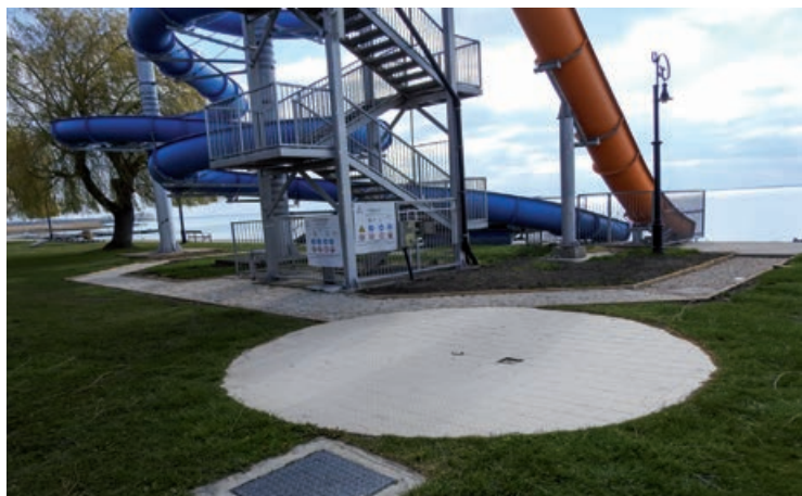
Kialakításra kerül a vízciszták kétoldali megközelítését biztosító járdaszakasza

Mindezeket túl önkormányzatunk önerőből újjátotta fel az öltöző-épület emeleti szintjére vezető külső lépcsőfeljárót és közlekedőfelületet. Új labdafogó hálót kapott a strand nyugati oldalán található strandfoci pálya, illetve a strand többi területével harmonizáló árnyékoló pergola került kialakításra a strand nyugati bejáratánál lévő zöldterületen.