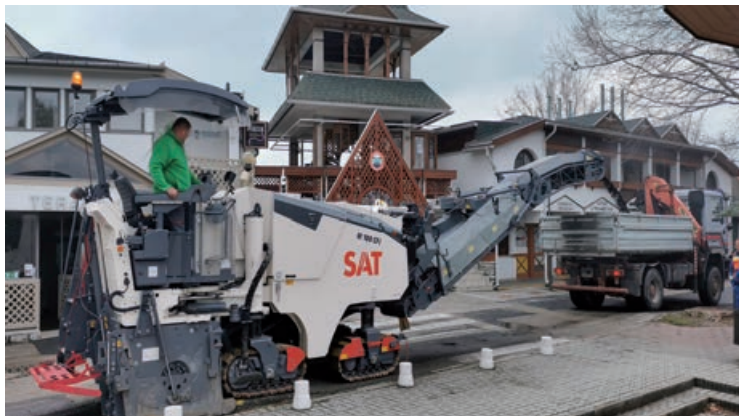
Már javában zajlanak az aszfaltozási munkálatok

A Magyar Állam nevében eljáró Nemzeti Infrastruktúra Fejlesztő Zrt. (NIF Zrt.) nemzetgazdasági szempontból kiemelt jelentőségűnek nyilvánított beruházása keretében, pályázati forrásból (KÖZOP-5.5.0-09-11-2012-0004) kerül felújításra a Balatoni Bringakör kerékpáros útvonal Tihany - Balatonalmádi közötti szakasza.