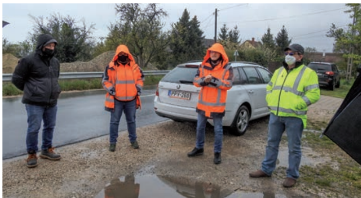
Megkezdődtek a munkálatok

Az érintett útszakaszon forgalomkorlátozásokra lehet számítani. Kérjük a lakosságot, hogy az érintett utcákban fokozott figyelemmel közlekedjenek!