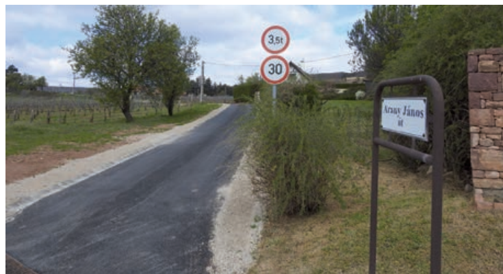
Elkészült az Arany János utca aszfaltozása

A II. Rákóczi- és Bencze László utcák után elkészült az Arany János- és Istenfia utcák útburkolatának felújítása is.