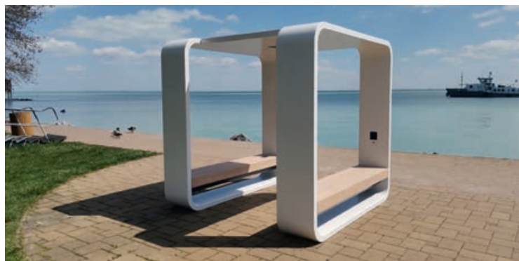
Megérkezett az KUUBE töltőpad

Pályázati forrásból kerül kialakításra a vendégek körében igen népszerűvé vált vízciszták kétoldali, baleset- és akadálymentes megközelítését biztosító járdaszakasza is, valamint a XXI. század igényeivel lépést tartva, szintén pályázattal finanszírozott az a nyolc férőhelyes napelemes mobiltöltőpad, amely az idei évtől a strand közelebbi partszakaszán várja a töltekezni vágyókat!