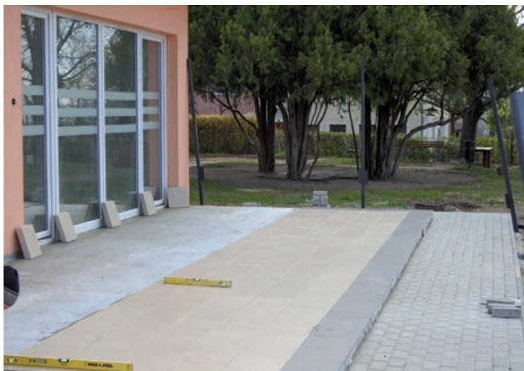
Beépítésre kerültek a nyílászárók

Nyár elejére befejeződhetnek bölcsőde építési munkái. jelenleg 75%-os készültségi szinten tart. A nyílászárók beépítése után, már a belső burkolási munkálatok folynak. A berendezések, eszközök beszerzése is folyamatban van.