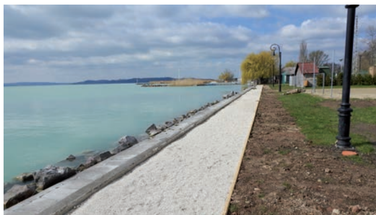
Folyamatban van a nyugati oldalon a járdaszakasz kiépítése