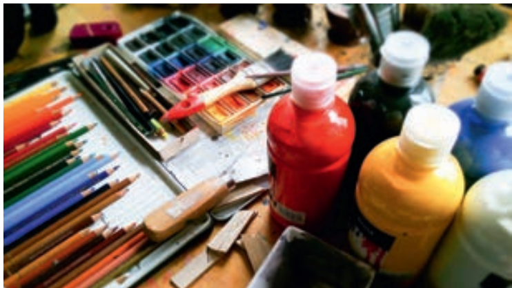
Az egyes alkalmakon más-más eszközök szolgálnának alapul a Csopak ikonikus helyszíneinek megjelenítéséhez

Minden település életére hatnak az ott élők és az újonnan oda-költözők, Csopakon sincs ez másként. Községünk kivételes légköre és meghittsége vonzza a családokat, némelyek néhány napnyi nyaralásra, mások életük helyszínévént választják.