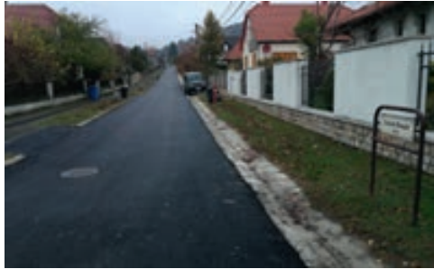
A felújított Szent Donát utca

- Igen. Valóban most folyik az ellátatlan területek csatornázása és a Kishegyi területrészt vízzel való ellátása. A csatornázás az Öreghegyi utca, Boróka utca, Füredi út, belterületi szakaszát, az arra rácsatlakozó utcák egy részét, illetve a Falukertje utcát érintik. A beruházás befejezésével szinte teljesen csatornázott lesz településünk. A másik beruházás az Öreghegyi és Kishegyi utcát, valamint az erre csatlakozó kisebb