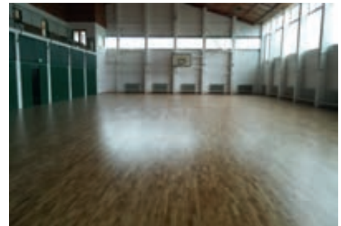
Az önkormányzattal saját forrásból valósították meg 10 millió forint értékben a tornaterem felújítását, a többlet költségeket pedig a református közösség vállalta át

- Nagyon jó volt a fogadtatása és a visszhangja. Azt látom, hogy a védőoltásokat sokan igénybe veszik, a tavasszal meghirdetett