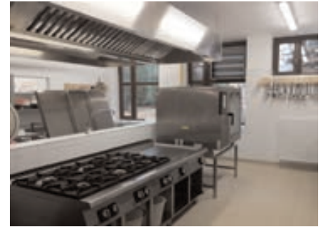
Egy modern gépekkel felszerelt, kényelmes, és a kor szellemének megfelelő konyha lett kialakítva, kiváló szakemberekkel

- Évek óta fontosnak tartottam, mindezt nyomon lehet követni, a testületi üléseken ennek többször is hangot adtam. A gyerekek biztonsága sokkal fontosabb annál, hogy pályázati forrásokban reménykedjünk, ezért az önkormányzat úgy döntött, hogy 10 millió forinttal támogatja a tornaterem felújítását, a többlet költségeket pedig a református közösségünk vállalta át. Így már idén egy felújított, biztonságos tornaterem várja a gyerekeket, sportolókat.