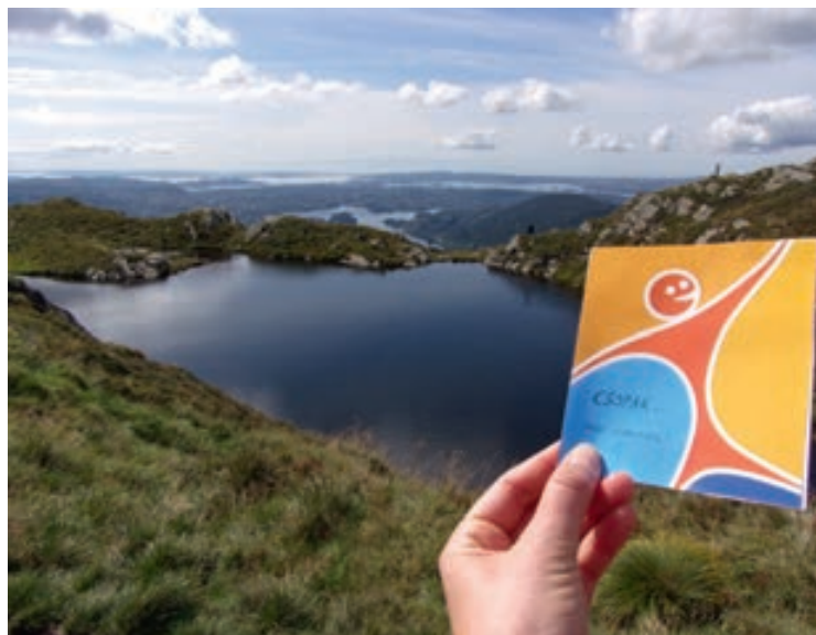
Norvégia, Bergen: Csopak a fjordok felett