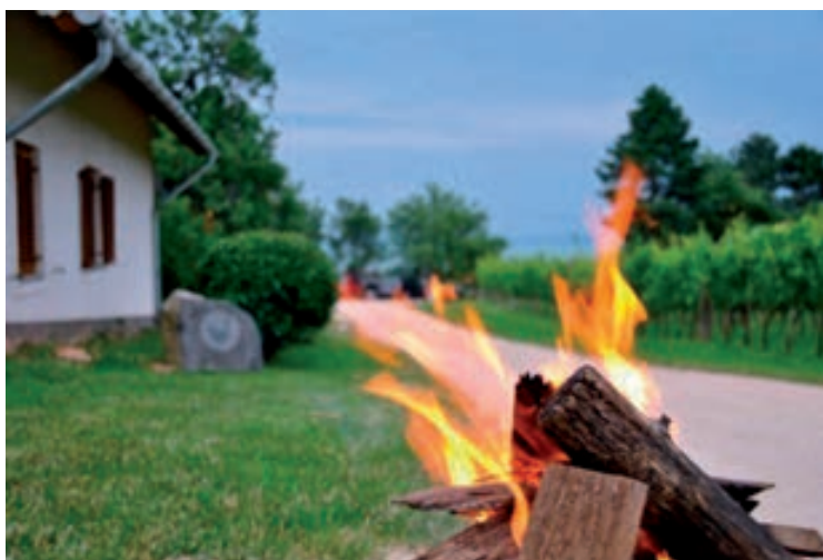
Június 20. - Olaszrizling éjszakája - Csopak Strand, valamint a résztvevő pincék