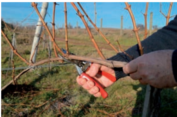
Fontos a szakszerű metszés