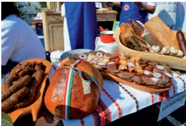
Március 21. - Csopaki Boros Toros - Fürdő utcai parkoló, Rendezvényszínpad