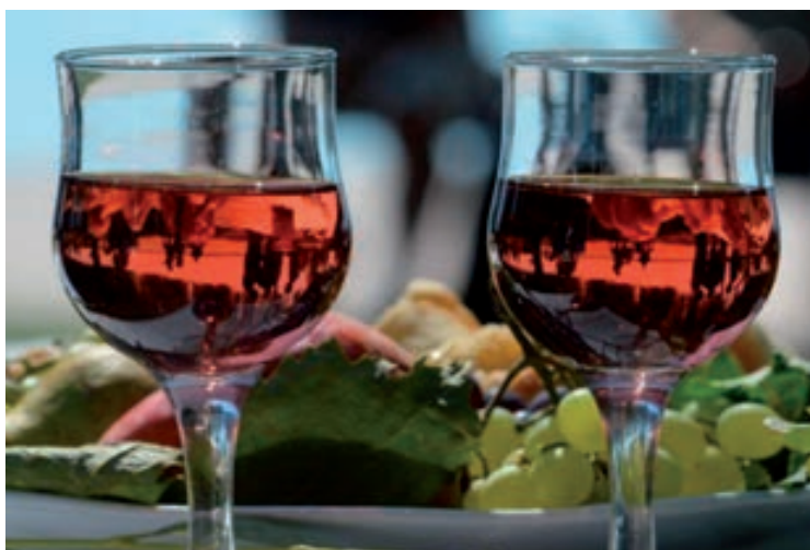
Május 23. - Május 24. - Pünkösdi Borpiknik - Fürdő utcai parkoló, Rendezvényszínpad