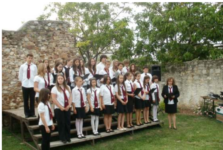
Az iskolások ünnepi műsora

(folytatás a 2. oldalon „Trianonra emlékeztek” címmel)