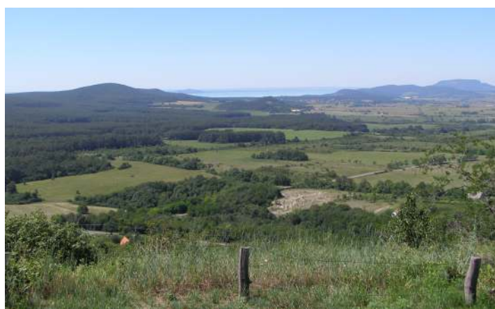
A megismételhetetlen Káli-medence