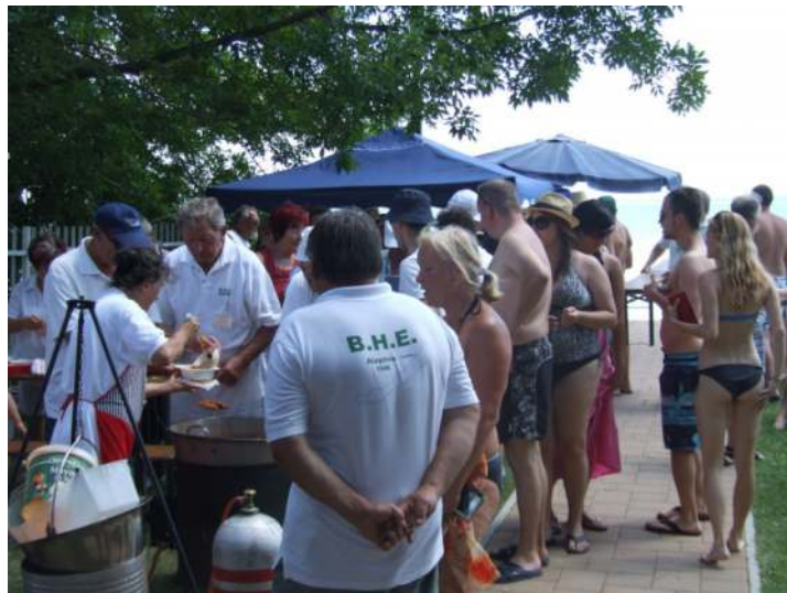
Szépen fogyott a halászlé