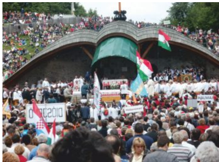
Ünnepi mise Csíksomlyón

Kértem a fiatalokat, hogy „szeressék a magyar anyákat”, mert elfogy a nemzetünk, és tartsák ébren a Csopak – Szováta testvéri kapcsolatot, amit 22-éve mi (most már) öregek elkezdtünk és vittük két évtizeden keresztül.