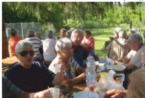
Madarak és fák napja