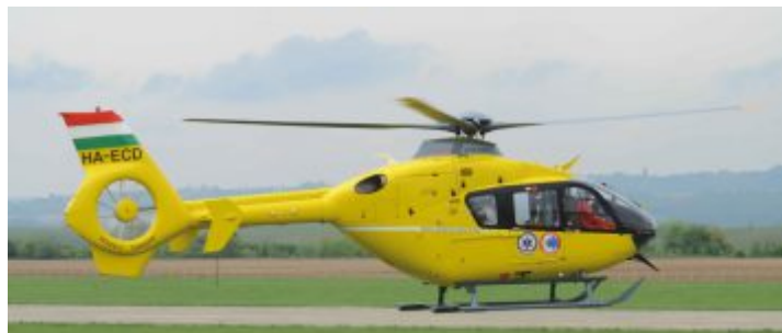
A füredi ment állomáson