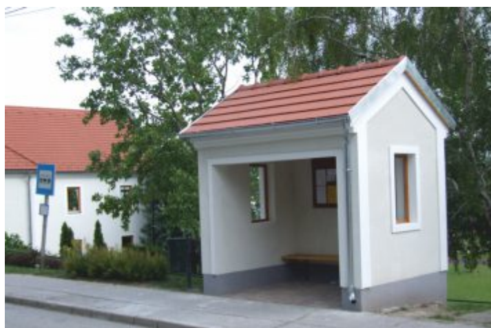
Megálló a Kossuth utcán