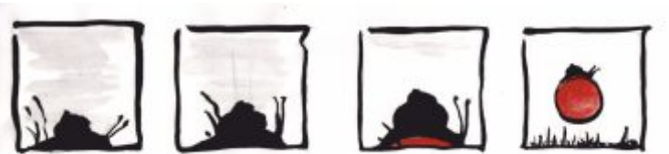
Hajnal (Tombor Balázs grafikája)