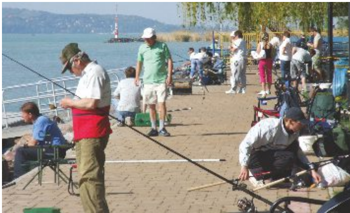
Pecások egymás közt