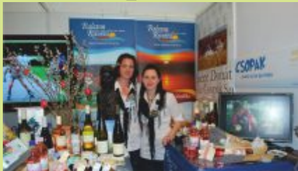
Egy cseppnyi Csopak Lengyelországban

2012. tavaszán Csopak a lengyelországi Krakkóban mutatkozott be egy nemzetközi utazás kiállításon. A község ötletes, vendégcsalogató standja nagy sikert aratott az érdeklődők körében.