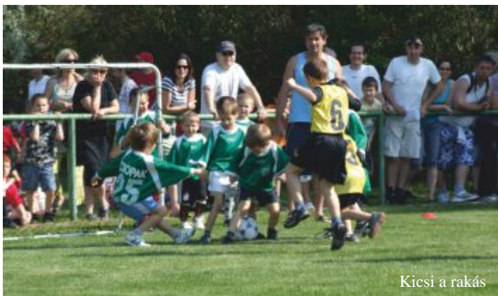
Kicsi a rakás