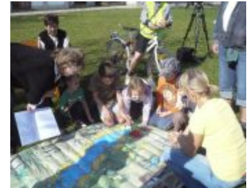
Megmozdultak a Víz Világnapján