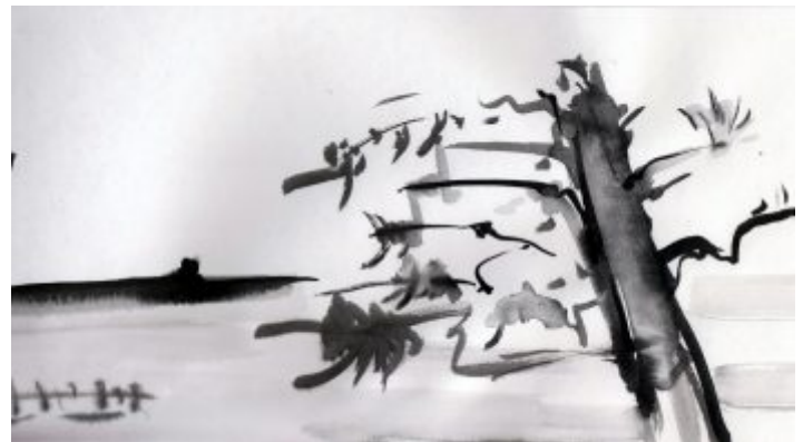
(Tombor Balázs grafikája)