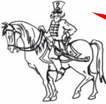
(Tombor Balázs grafikája)