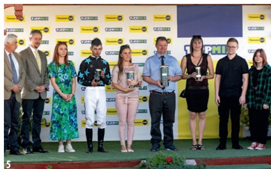
1. Az Overdose-szobrot is megkoszorúzták a díj győztesei | 2. Díjátadás az Overdose Díj után | 3. Elindultak a legjobb magyar háromévesek | 4. Seventy Smile biztosan nyerte a Magyar Háromévesek Nagydíját | 5. Díjátadás a Magyar Háromévesek Nagydíja után

ver Peppert, Light Blue Skyt, az újra formába lendült Levendulát, Dante's Peaket és Báthoryt is. A jó tempóra a két utóbbi gyors ló indulása jelentett garanciát. A verseny a várakozások szerint indult, azonban a teljes mezőny közel haladt egymáshoz. A célegyenesbe fordulva Báthory és Dante's Peak elfáradt, miközben a kanyarban nagyot botlott Ocasio Cortez, és Light Blue Sky (GB, 3pk, Adaay