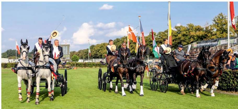
■ A magyarok tiszteletköre