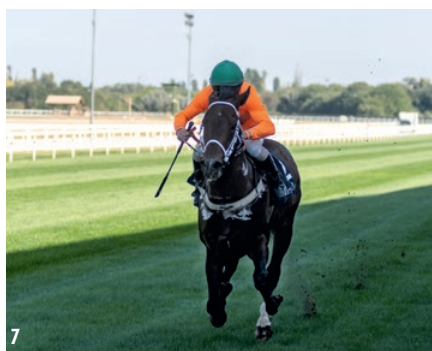
■ 1. Eggi's Choice a jártatóban | 2. Koszorúzás a Kincsem-szobornál | 3. Light Blue Sky nyerte az Imperiál Díjat | 4. Finis az Imperiál Díjban | 5. Díjátadás az Imperiál Díj után | 6. Vain Hope és Marlon | 7. El Prado's Joy

nem tudott küzdelemben kerülni, és a nyolc induló között az ötödik helyet szerezte meg. A Kincsem Díj megnyerésével élete legnagyobb sikerét aratta és eddigi legmagasabb pénzdíját vihette haza. Hogy a sikere mit jelent? Markoni LP versenyben elért 75-ös hendikepszámát látva elmondhatjuk, hogy az elmúlt három év Kincsem Díjai ennél erősebbek voltak, hiszen tavaly Opasan 1,5, két éve Nancho