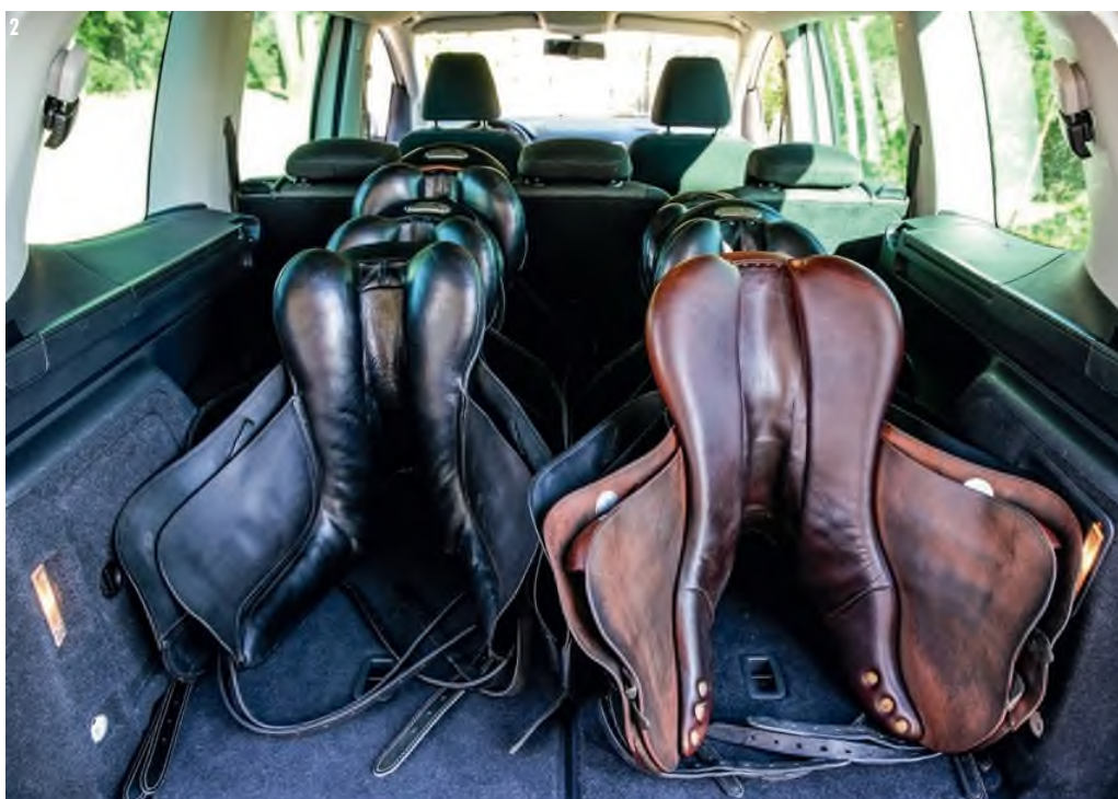
■ 1. Krausz Ágnes | 2. Az új autóba akár 50 nyereg is befér