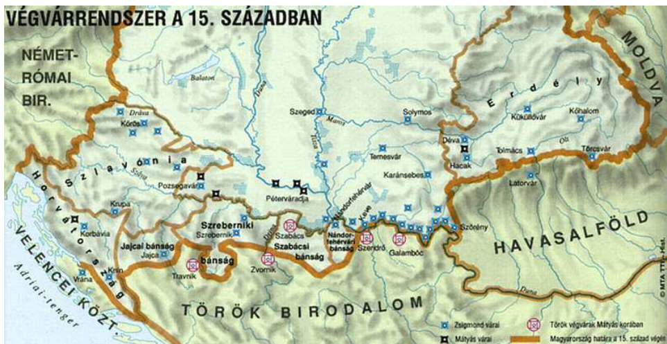
1. számú térkép Végvárrendszer a 15. században

arra gondolt, hogy a hadműveleteket az ország határain kívül tudja tartani. Boszniát, Szerbiát, Havasalföldet és Moldvát próbálta a Magyar Királysághoz kapcsolni. Az Oszmán támadás ekkor még az ország területi egységét nem bontotta meg, a végvárrendszer többek között pont ennek védelmét volt hivatott szolgálni. Ezek a fejedelemségek azonban csak addig ismerték el a magyar király főhatalmát, amíg a törökkel szemben számíthattak rá. Ha Magyarország meggyengült, az oszmánokkal próbáltak barátkozni” 14 A végvárakat ekkor a Magyar Királyság déli határán építették ki, ahogy a két térkép 15 16 is látszik.