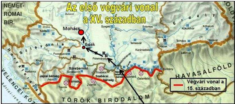
2. számú térkép