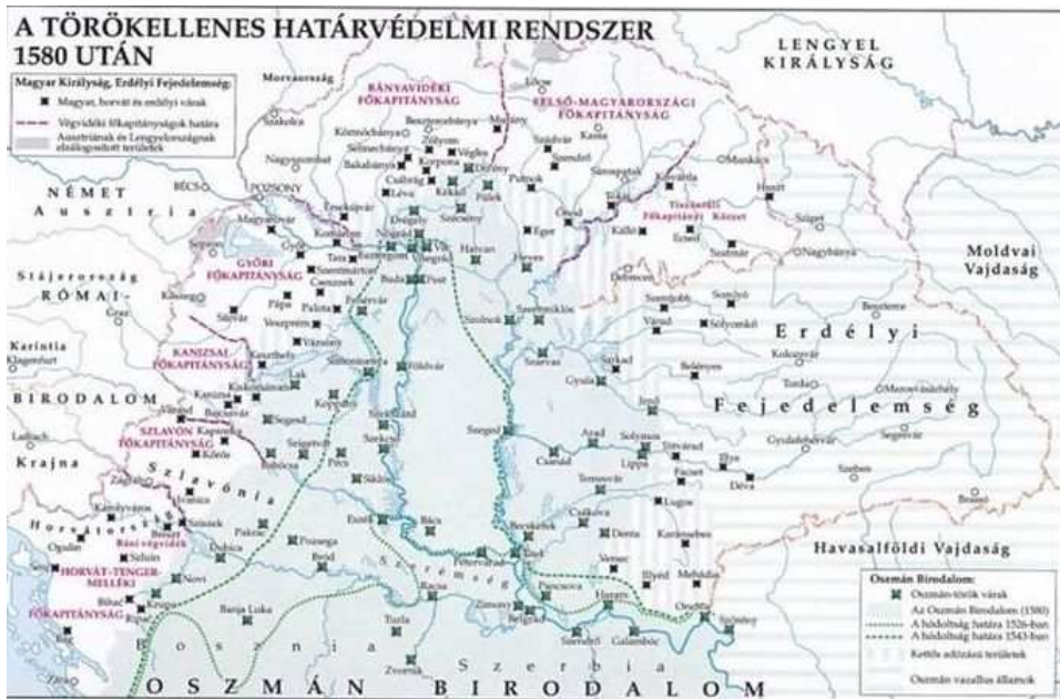
4. számú térkép

Toth Ádám Viktor – Polgár Miklós: A végvárrendszer, mint határvédelmi és határőrizeti intézmény kiépítésének alapjai és gazdasági bázisa a Magyar Királyságban