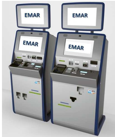
6. számú kép EMAR Kioszk

Az EMAR kioszk egy az alábbi hardverekből, perifériákból állítható össze: