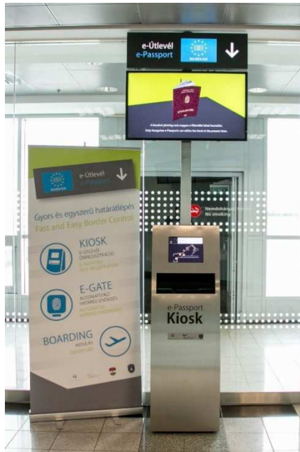
3. számú kép Kioszk az LFNR 2. terminálon

A sikeres okmányolvasást követően az utas adatai egy ideiglenes adatbázisba kerülnek, amelyet a rendszer az utas ujjnyomata és az okmányban elhelyezett chipben tárolt ujjnyomat összevetése céljából kezel a határátlépés időpontjáig. A rendszer második eleme a zsilipkapu, amely a Liszt Ferenc Nemzetközi Repülőtér 2-es Terminál indulási szintjén, a schengeni térségből kilépő utasok határellenőrzésére kijelölt területén került telepítésre. A zsilipkapuban az utasok ujjnyomatukkal azonosítják magukat. A levett ujjnyomat-minták összevetésre kerülnek az ideiglenes adatbázisban tárolt adatokkal, azonosság esetén a zsilipkapu ajtaja kinyílik, és az utas átléptetése megtörténik. Ez persze a kifejlesztendő EMAR kioszk esetében nem a határforgalom ellenőrzését, hanem a migránsok személyazonosítását és regisztrációját szolgálja.