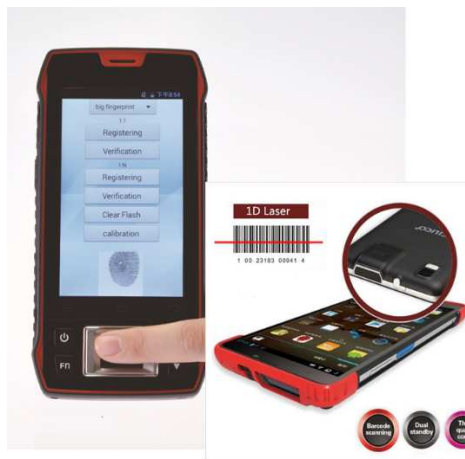
7. számú kép Mobil EMAR

Ilyen esetekben a ZTE mobil eszközre kifejlesztett „Mobil EMAR” alkalmazás nyújthat segítséget.