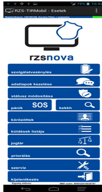
4. számú kép RZS TIRMobil főmenü

Javaslatom szerint ide szükséges beilleszteni a „Járőrjelentések” menüpontot, azon belül választható lenne a „Jelentés elfogásról” vagy „Jelentés terepkutatásról” almenüpont. A „Jelentés elfogásról” gombra kattintva a járőr az alábbi lehetőségeket választhatja ki.