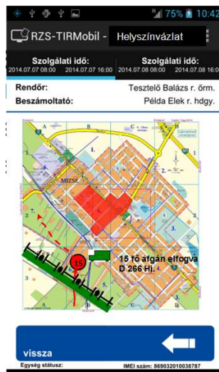
5. számú kép Helyszínvázlat

A „ Helyszínvázlat készítése ” menüpontban a járőr az applikáció által megjelenített térképen rábökéssel meg tudná adni az elfogás pontos helyét, melyet a mobil eszköz GPS vevőjének jele alapján a program azonnal be-kódol és a korábban megadott személyi statisztika, idő és mozgási irány alapján azokat elektronikus térképre rajzolva automatikusan helyszínvázlatot készít így az később elektronikusan vagy igény szerint kinyomtatva áll rendelkezésre.