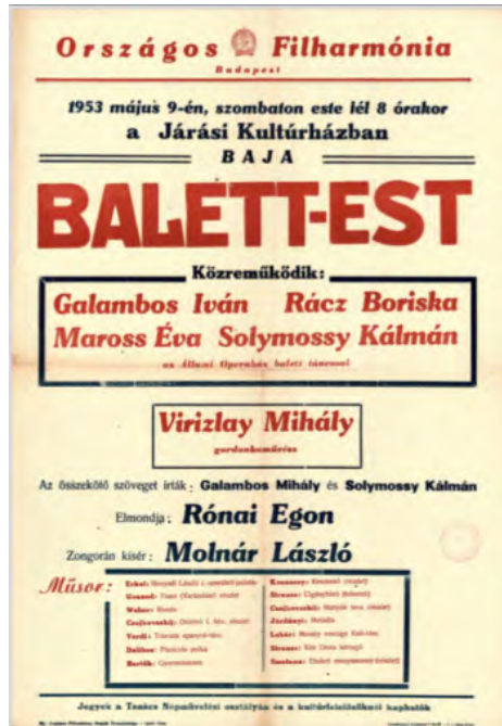
10. ábra: Szórólap a Bajai Városi Művelődési Központban tartott balett-estről Solymossy Kálmánnal és más operaházi táncosokkal (Országos Filharmónia Szegedi Kirendeltsége - Lippói Gyula, n.d.)