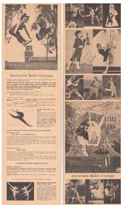
7. és 8. ábra: Az ausztrál Ballet Comique szeptember-októberi műsorfüzete 1970-ből. ([Australian Ballet Comique : Programok és kapcsolódó anyagok az Ausztrál Nemzeti Könyvtár gyűjteményében].)