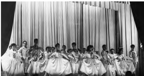
2. ábra: A palotás a Prahran Town Hall 1960. márciusi előadásán (Szeverényi, 2014b)