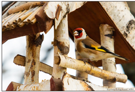
A látható madárfaj neve – Tengelic ( Carduelis carduelis )

A legjobban bevált téli madáreléségek az olajos magvak, különösen a nem pörkölt és nem szózott fekete napraforgó. Etethetünk még más apró szemű magvakkal: kölessel és mákkal is. Adhatunk mogyorót és megtört formában diót is. Állati eredetű zsiradékot is tegyünk ki, de csak olyat, ami