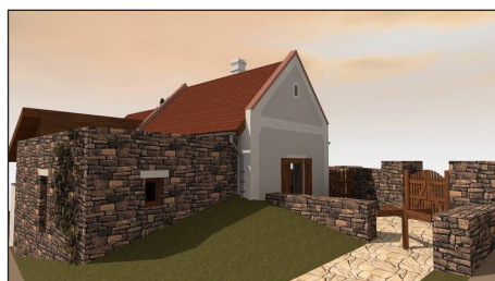
Bővíti a Salföldi Major fogadóépületét (látványterv)