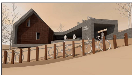
Látogatóközpont épül a Lóczy-barlangnál (látványterv)