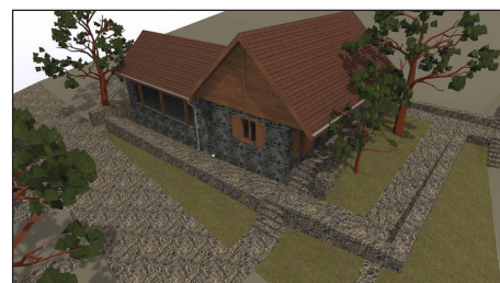
Megújul a Hegyestű Geológiai Bemutatóhely (látványterv)