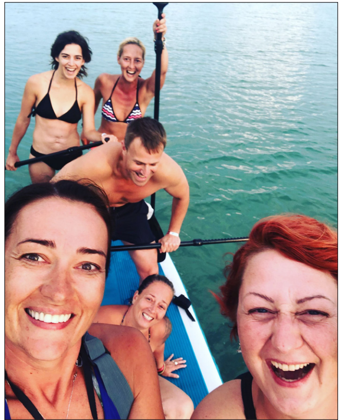
Edináéknak van egy nagy „csapatszállító” deszkájuk is. Ezen különösen vidám együtt talpon maradni