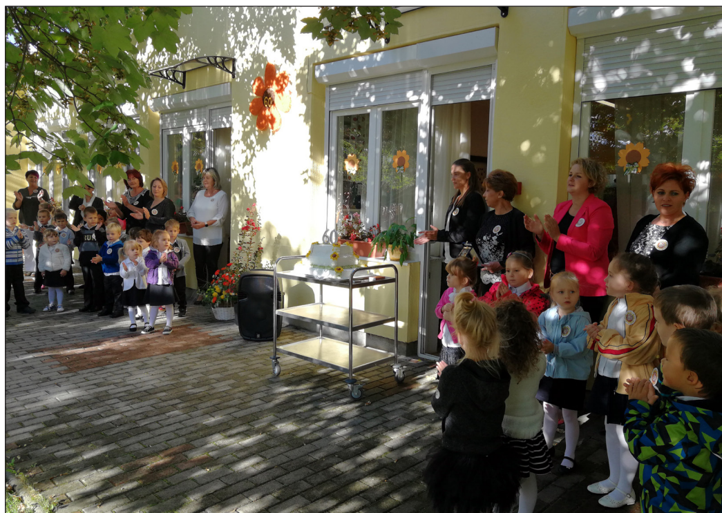
Az óvoda 60 éves fennállását születésnapi tortával is ünnepelték