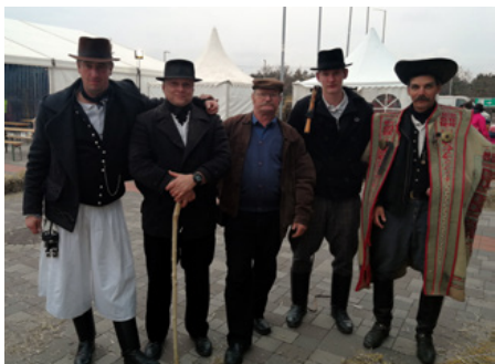
A betyár „különítmény”

Idén is képviseltette magát a lovasi Hunyadi Huszár és Betyár Hagyományörző Egyesület, mely 1997-ben alakult. Tagjai környékbeli lótaratók, állattartók. Céljuk az állattartási hagyományok őrzése, ápo-