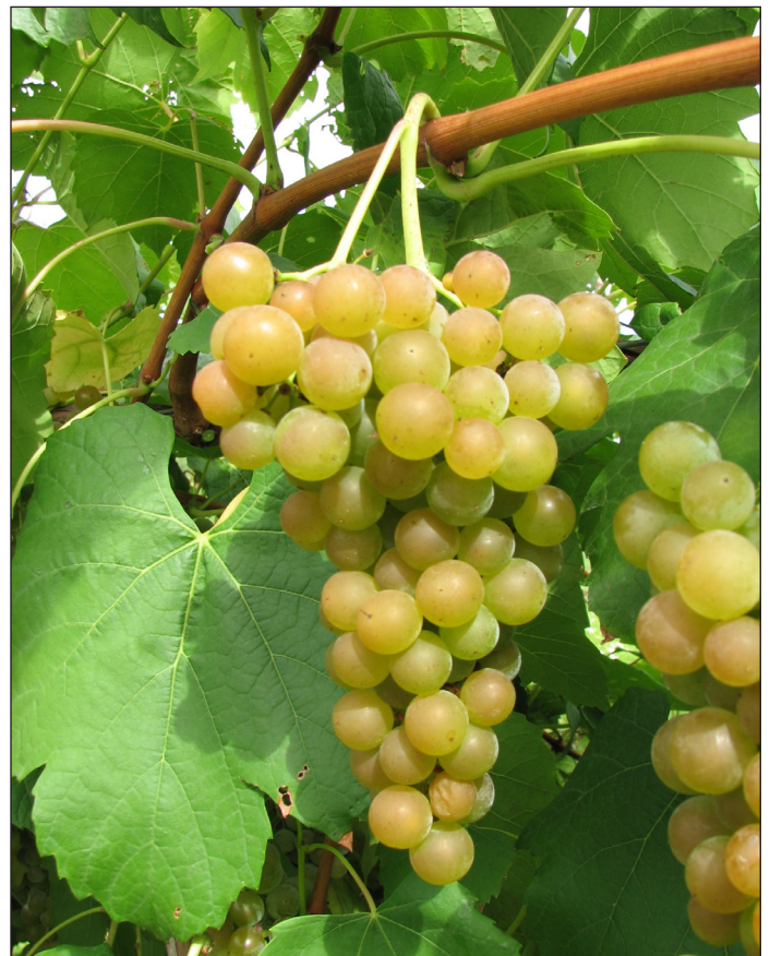
A szőlőnek egész évben szüksége van a gazdájára