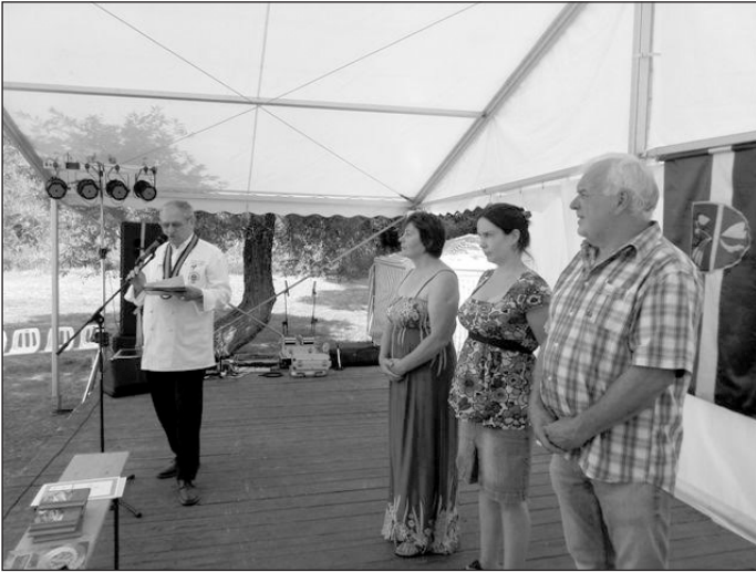
A zsűri és a polgármester asszony az eredményhirdetés előtt

A lovas akadálypályán már hagyomány, hogy minden évben megrendezik a Lovas Egyesület szervezésében a lószépségszűri és a lószépségszűri, most sem volt ez másképp. A versenyről bővebben Kis Áron írásában olvashatnak.