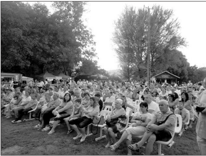
Sokan várták Csepregi Évát...

belopta magát az emberek szívébe. A népszerű énekesnő-általános iskolásként tanult zongorázni, később pedig hegedülni. Egy évig a Magyar Rádió gyermekkorában, majd 1970-ben Hoffmann Ödönnél tanulta az éneklést. A Kócbabák nevű trióban tűnt fel először az 1972-es Ki mit tud?-on, Pál Éva és Fábíán Éva társaságában énekelt, a matematika érettségi előtti napon. A Neotonnal 1973 végén társultak, 1977-ben Neoton Família néven hivatalosan is egyesültek. Napjainkban a Neoton Família