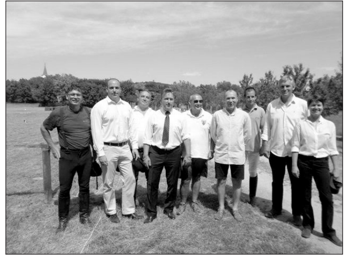
Polgármesterek-alpolgármesterek a fogathajtó verseny előtt