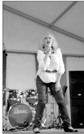
... aki hatalmas sikert aratott

Sztárjai formációban szokott fellépni. Természetesen a legnagyobb slágereket most is elénekelte, a közönség többször is visszatapsolta. Az első nap a Búgócsiga együttes utcabájljával zárult. Ismét bebizonyították, hogy nem véletlenül a környék legnépszerűbb együttese, hiszen gazdag repertoárjukból a mulatók zenétől kezdve a rock and rollon át, napjaink legismertebb slágerei is felcsendültek. Másnap reggel 9 órakor folytatódott tovább a Lovasi Napok. Idén 12 csapat nevezett a pörköltfőző