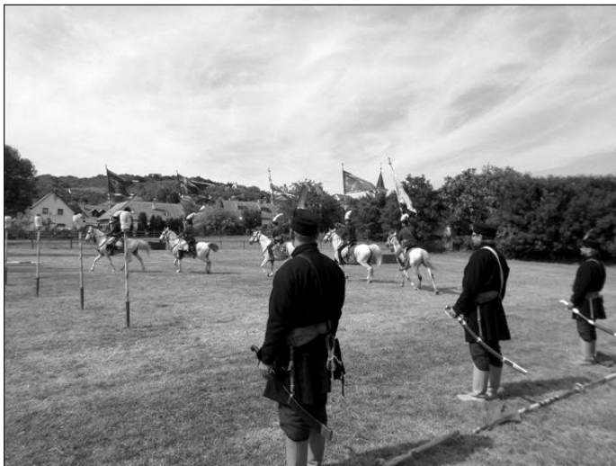
Török kori lovagitorna a Salföldi Kópjásokkal