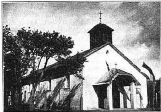
A szentelést váró kápolna.