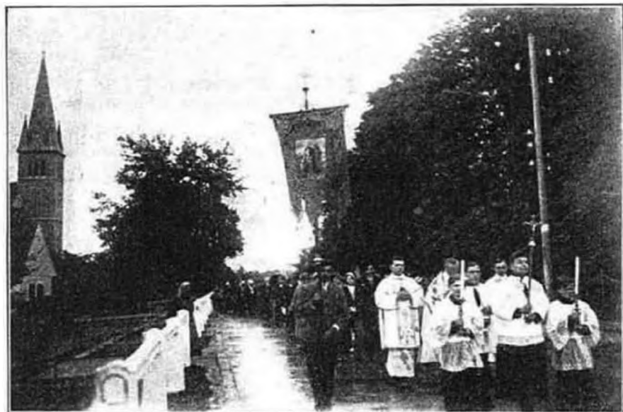
Útban a kápolna felé. (Balra a neszmélyi templom tornya.)

Amikor híre futott Budapesten, hogy a kápolna annyira elkészült, hogy nemsokára megáldható lesz, napról-napra nagyobb lett az érdeklődés