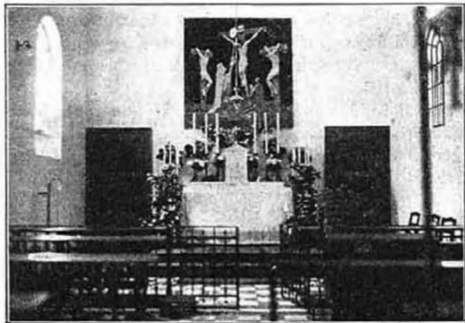
A felszentelt kápolna oltára, az első szentmise után.