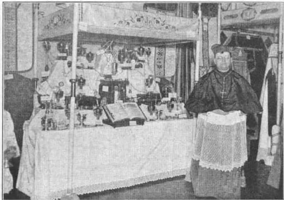
A Központi Oltáregyesület kiállítása. Felszentelés után a hercegprimás megtekintette a kiállítást.

És mégis a krisztusi szolgálat megfoghatatlan nagy dicsőség és megbecsülhetetlen nagy tisztelet a pap számára. A papok Krisztus művének, a