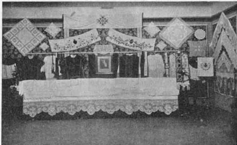
Az angyalföldi oltáregyesület kiállításáról.

E felségesen szép szertartásnak legszívbemarkolóbb része minden bizonynyal az volt, amikor a katolikus liturgia szerint előírt legnagyobb pompa és