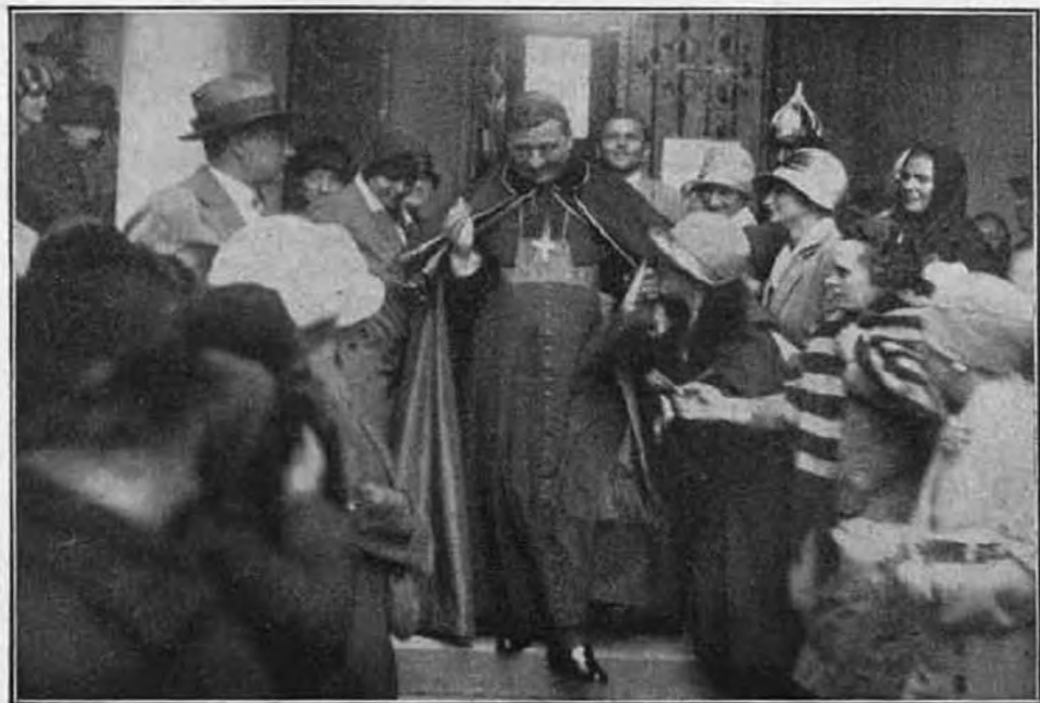
Öminenciája a Központi Lelkigyakorlatos házon keresztül távozik.

2. Itt Budapesten a józsefvárosi plébániából kihásítottak egy új plébániát, mely Krisztus királyságáról van elnevezve. Érdekelt, hogy mi a kis ideiglenes kápolna oltárképe. S mit gondoltok, mi ez? Az «Ecce