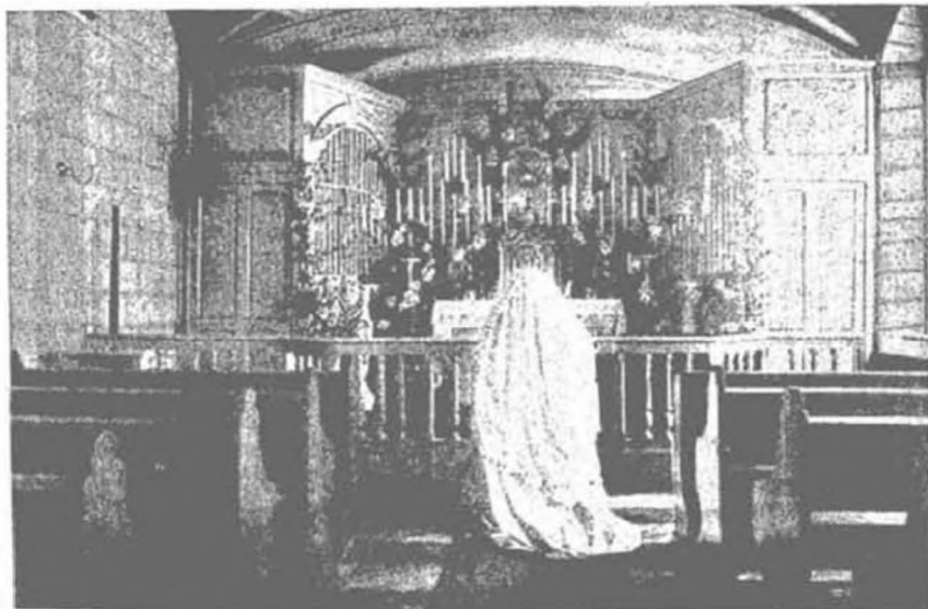
A szentségi Jézus 25 év előtti trónja (a Rákos-utcai oltár).

A mai szent evangéliumot bizonyára hallottátok: « Én vagyok a Jó Pásztor. Én ismerem enyéimet és enyéim ismernek engem ». Talán egyetlen kép sem oly bájos, mint ahol az Úr Jézus elének áll, mint Jó Pásztor és amikor a Jó Pásztor hangsúlyozza, hogy Ő mindenkinek mindene. Sajnos, hogy a Jó Pásztor nyájának egy nagy része, amely hivatva volna