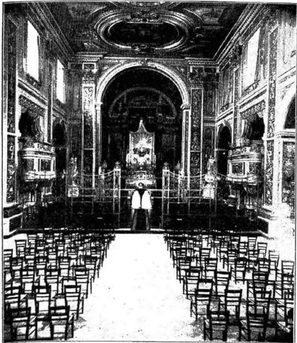
A Mária Reparatrix-apácák római anyaházának kápolnája.

gazdagok nagyösszegű adományainak s a szegény emberek filléreinek — melyeknek még nagyobb értékük van — összefolyása tette lehetővé,