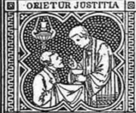
ORIETUR JUSTITIA ET ABUNDANTIA PACIS