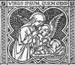
VIRGO IPSUM, QUEM GENU IT DEUM ADORAVIT.

XIX. ÉVF 1918 11. SZÁM ÖRÖKIMÁDÁS HAVI FOLYÓIRAT A LEGMÉLT. OLTÁRISZENTSÉG IMÁDÁSA S SZEGÉNY TEMPLOMOK FELSZERELÉSÉNEK ELŐSEGÍTÉSÉRE HIVATALOS KÖZLÖNYÖL KIADJA A BUDAPESTI ORSZ. KÖZPONTI OLTÁREGYESÜLET Szerkesztőség-kiadóhivatal Bpest, Üllői-út 77. Ára egy évre 5 korona. Megjelenik minden hó elején. Stephanicum nyomda r. s.