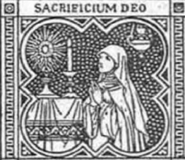
SACRIFICIUM DEO SPIRITUS CONTRIBULATUS