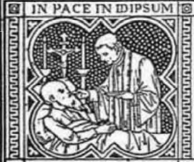
IN PACE IN IDIPSUM DORMIAM ET REQUIESCAM