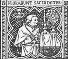
FLORABUNT SACER DOTES PARCE POPLULO TUO.