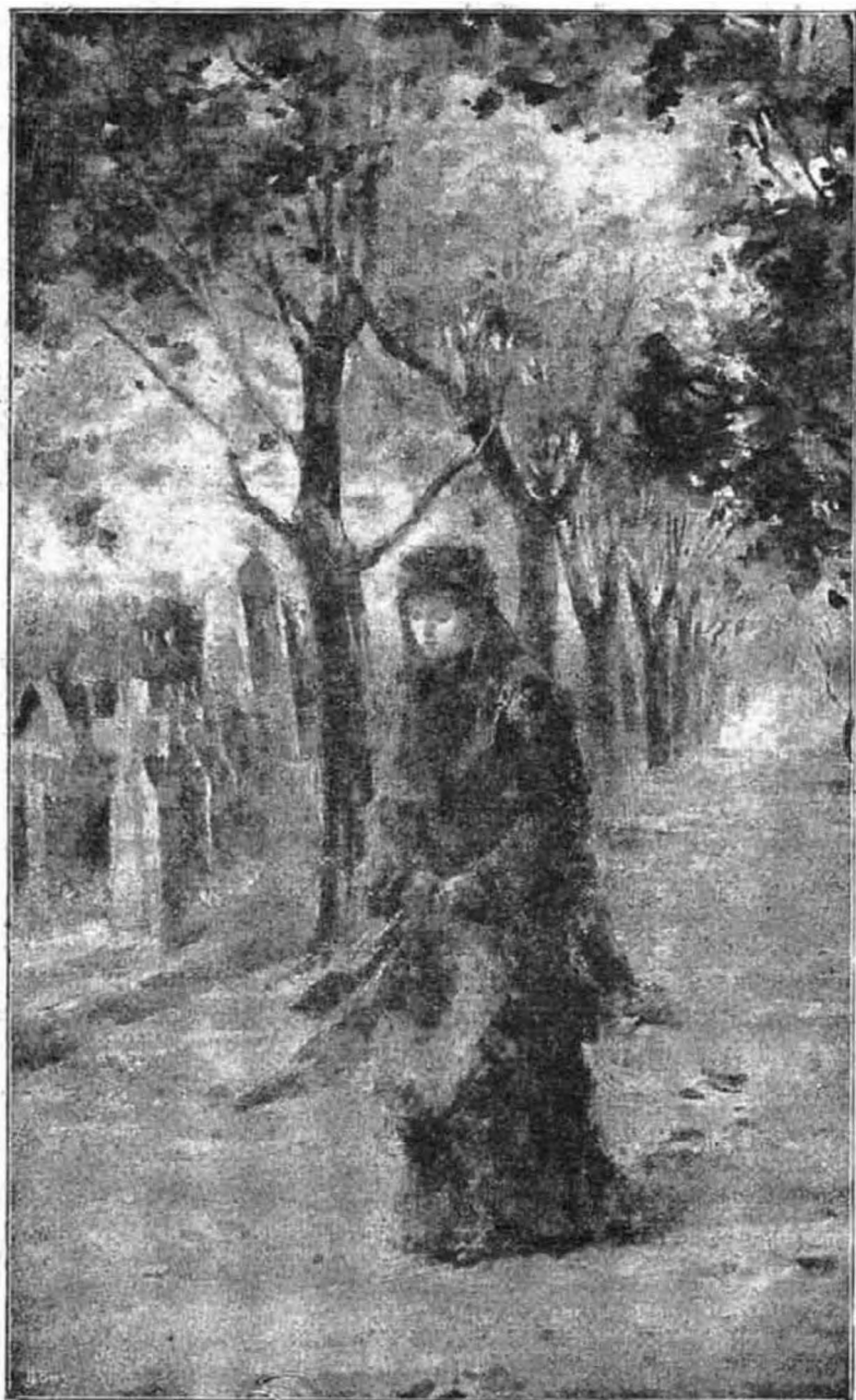
«Ne sirj,» (Lk 7. 13.)