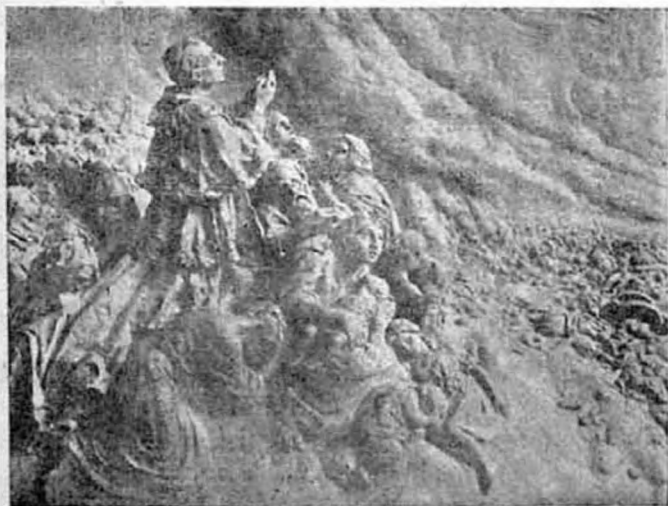
«Hozzád futunk Úr Jézus és a te szentséges Szivedben keresünk az utolsó menedéket.»

E nagy khaoszbán és zürzavarban, amelyben a világ forog, vajjon ki tud rendet teremteni?