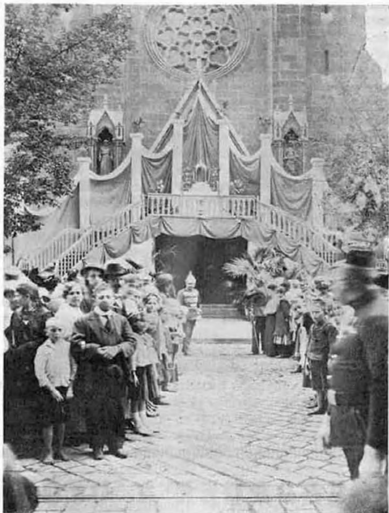
Az Örkimádás-templom úrnapi körmenetéből: Oltár a bejárat fölött.

szögletes idomait. A gyertyatartók között pompás élővirágok illatoztak — hátul az emelkedettebb helyen cserépben, elül alantabb pedig csinos vázákban, lengő bokrétákba kötve.