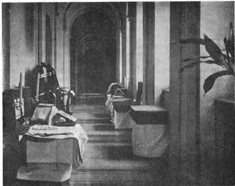
Az Oltáregyesület kiállításából: tábori kazetták.