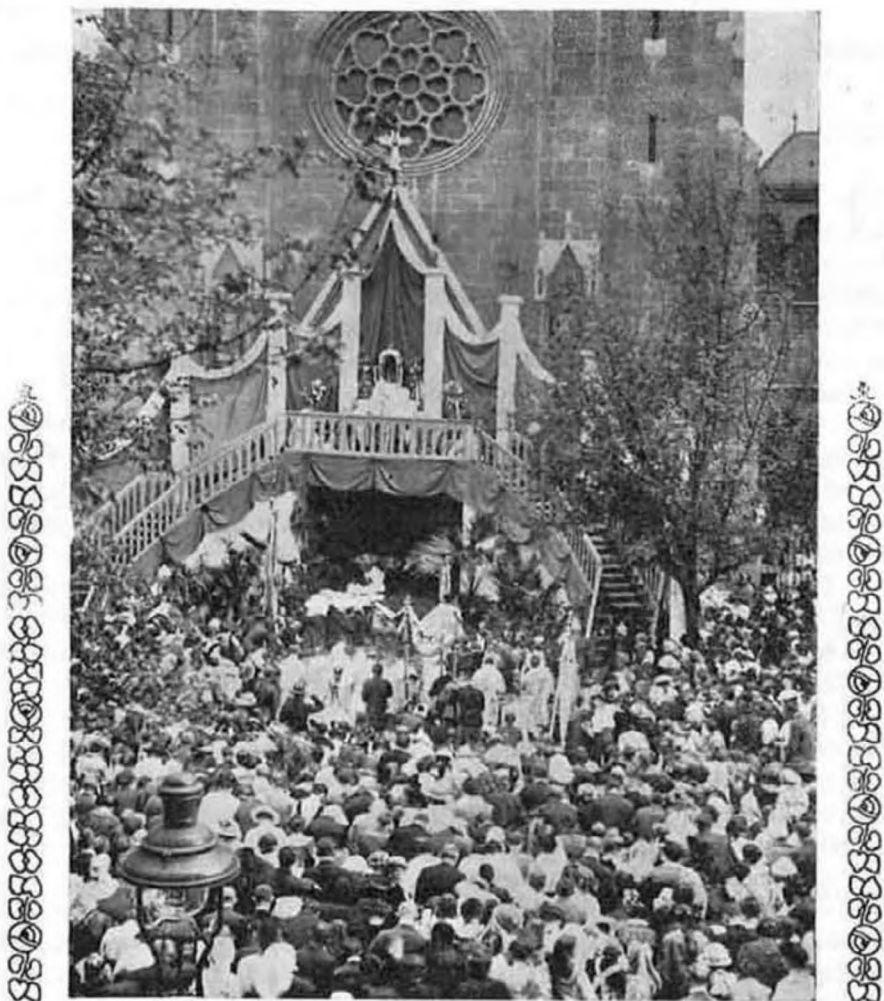
A Celebráns pedig áldást osztott keletnek, nyugatnak.

kegyelmei s áldásai bőségében részesít. Ki tudná azok számát, akiket e hosszú időn át áldásaiban részesített!?!... A legméltóságosabb Oltáriszentségben jelenlévő Jézusnak tudhatjuk csak be, hogy az egyháznak