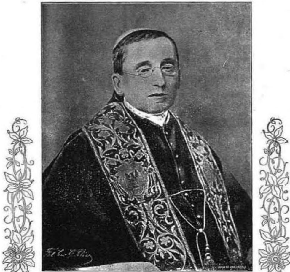
XV. Benedek pápa folyton a békén dolgozik.

Attól a perctől kezdve valósággal kettős életet élt a művészelkű kántor. A maga saját életét csak vegetálta, minden életenergiáját pedig abba a másik művészi életbe öntötte, amelyeket orgona és énekszóval a nagy Király udvartartása töltötte ki. Fényes dómokban nem hangzottak