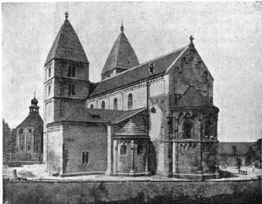
A jáki templom.

A németországi püspöki kar az első szentáldozásról szóló közös pásztorlevelében a szentáldozást «a leghatásosabb és a legnélkülözhetetlenebb kegyelemeszköznek» mondja, mely a keresztségben nyert