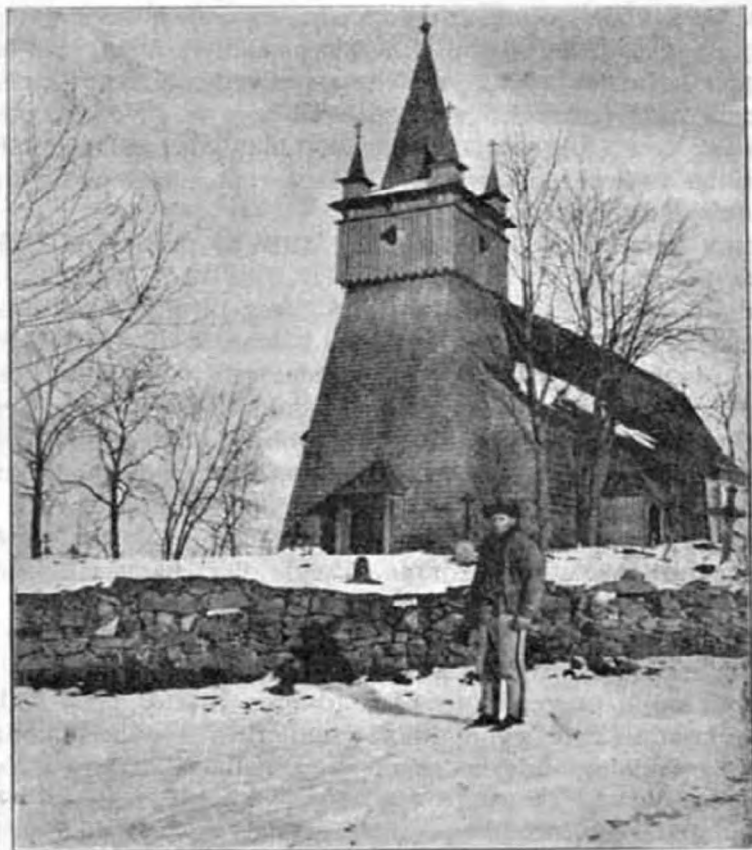
A podmiki fatemplom, teljesen fából van építve.