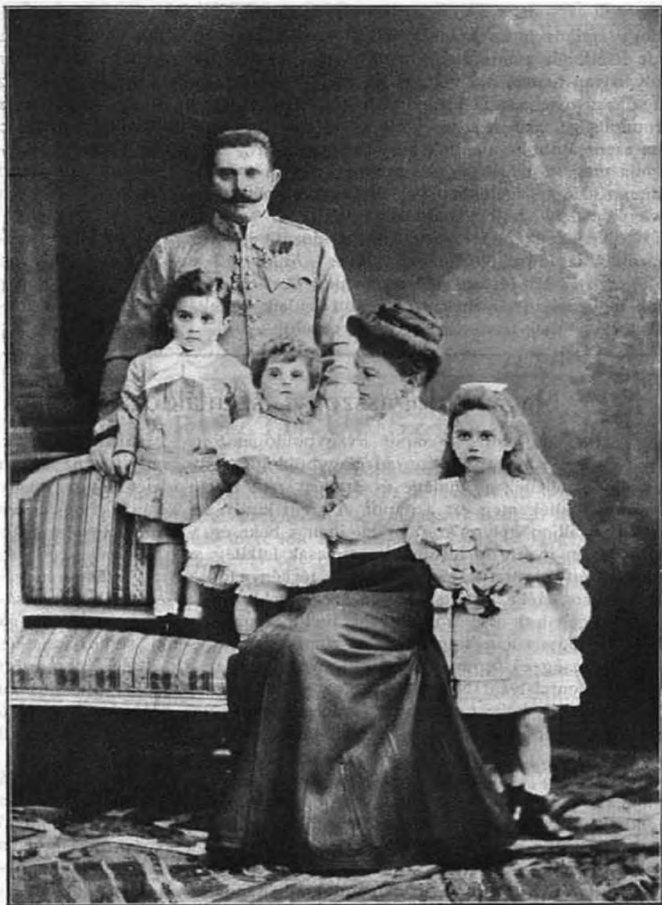
† Ferenc Ferdinánd trónörökös és családja.