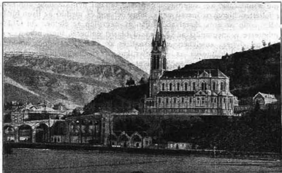
Lourdes, a XXV. euch. vilá kongresszus színhelye.

Egy a Krisztus egyháza, mert tagjai egyazon hitet vallják, egyazon szentségekkel élnek és a szent misét áldozatul tisztelik. De praktikusán az egyház egységét legjobban az eucharisztikus kongresszus nagysága mutatja. A szívnek, léleknek, meggyőződésnek, lelkesedésnek, erős istenhítnak és imádatnak mélységes érzései hatják át az egész keresztény világot és ennek szívbeli és lelki egybeolvadásnak eszközlője a legméltóságosabb