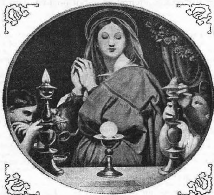
Ingres: Szűz Mária imádja az Oltáriszentséget.

A francia származású Ingres Domonkosnak is van egy Mária de Eucharistia képe. Oltáron álló kelyhen rajta lebeg a szent ostya, két oldalán