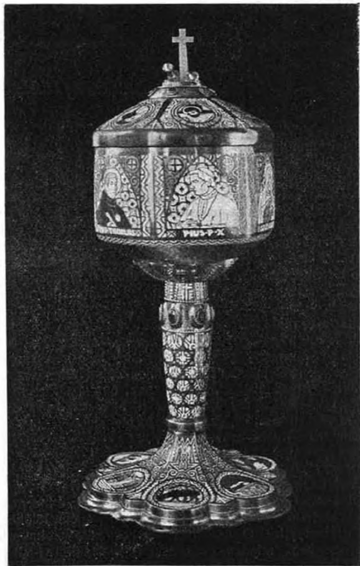
Örökimádás-templom áldoztató kehelye.

Az új áldoztató kehely a diadalmas husvét ünnepén került alkalma-