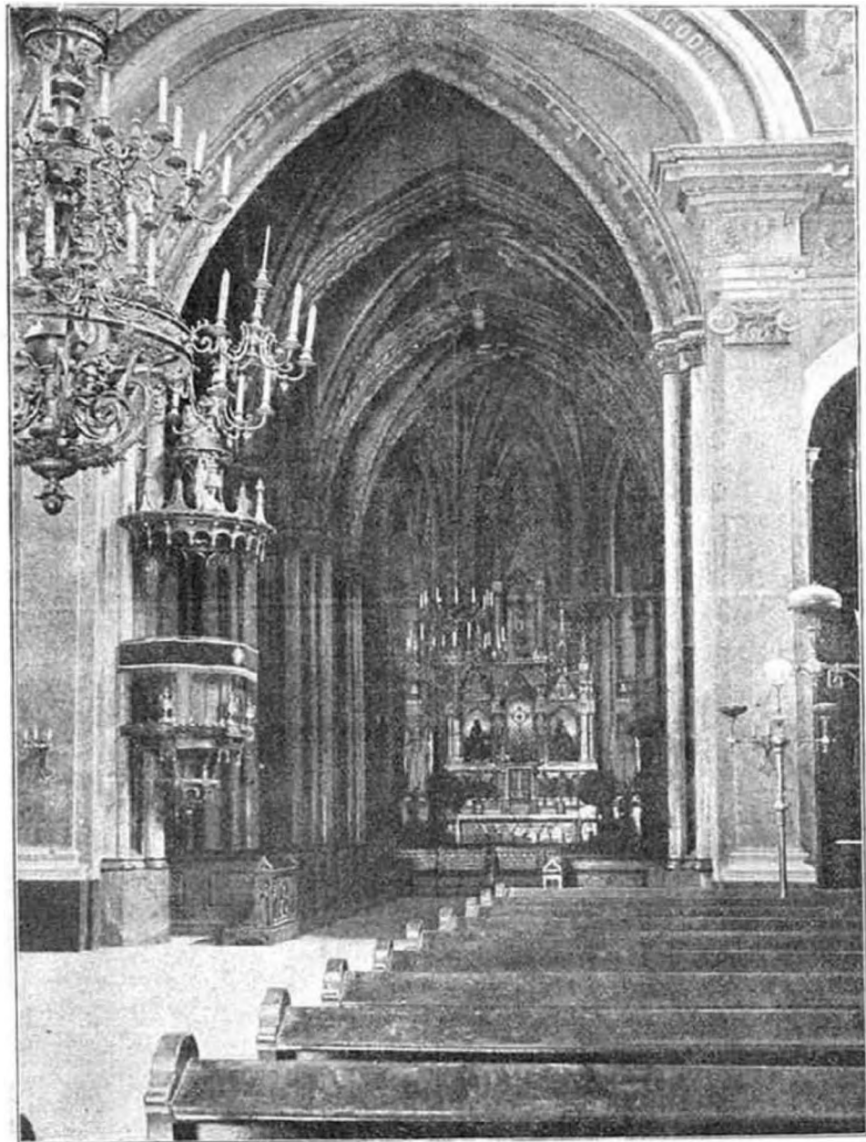
Budapest-Belváros-i templom díszes főoltára, ahonnét egy gonosz kéz az Oltáriszentséget elrabolta.