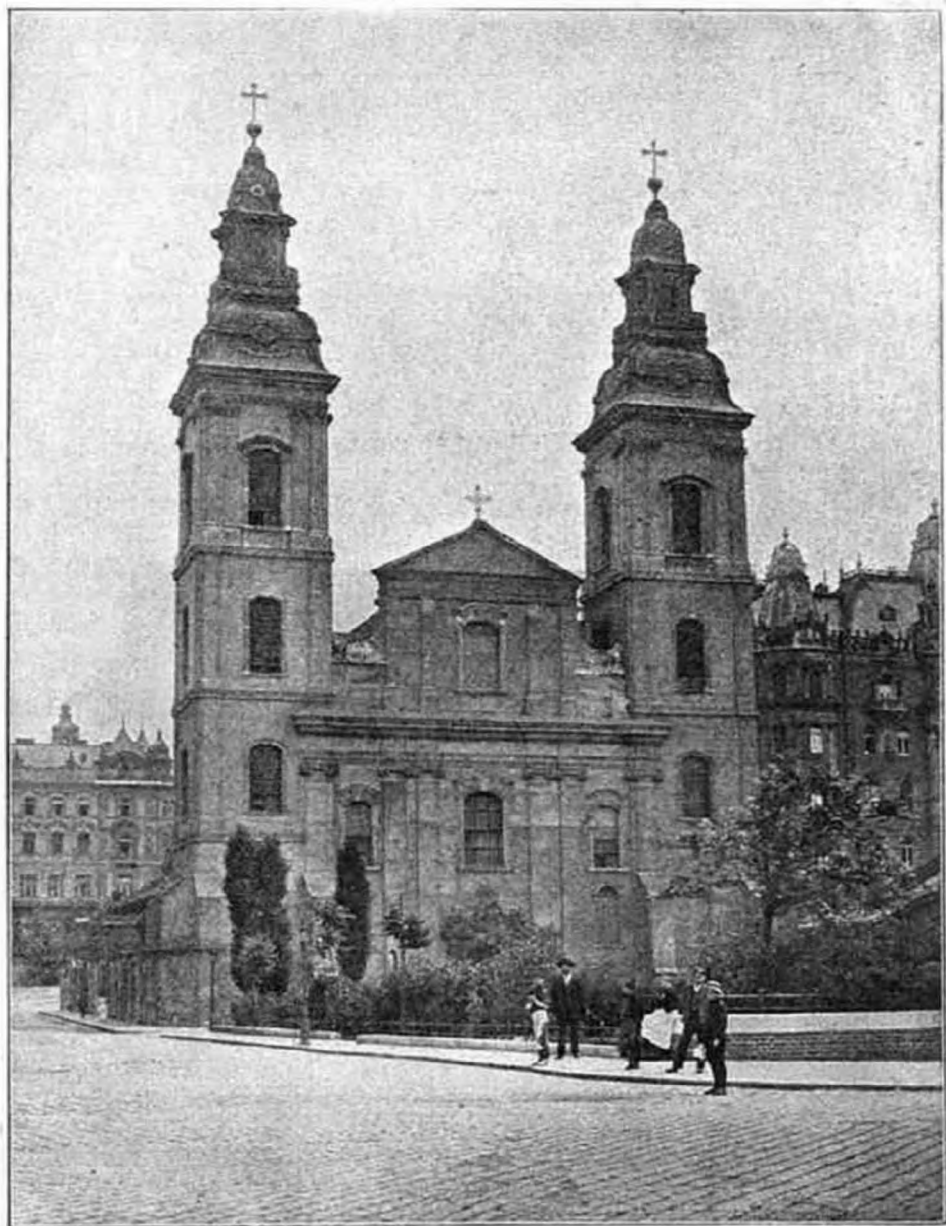
Budapest-Belváros-i templom kívülről.