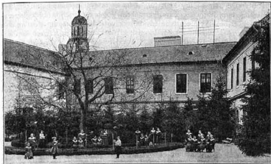
A nagyváradai Immaculata-intézet, melynek összes növendékei tagjai az euchi. Gyermekszövetségnek.

Elmondja a mamának. «Édes jó feleségem — így szól, mikor a