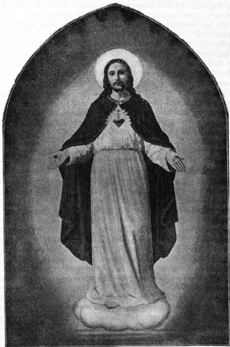
Jézus leghentebb Szive.