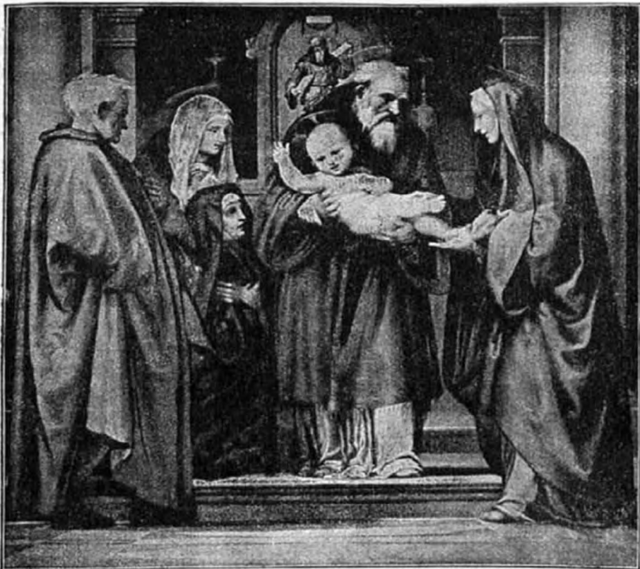
A kis Jézus bemutatása a templomban.