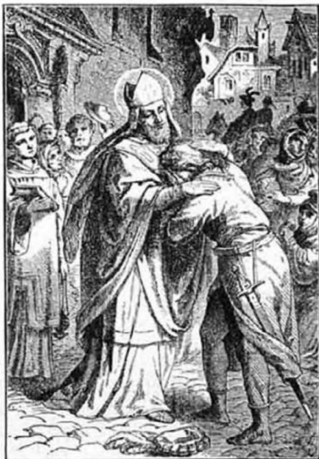
Szal. szent Ferenc.

Nyitva van az ablakom, szunyog dűnyögést hallok, körül nézek, az apró zümmögő kis bogárkát, hasztalan keresem, nem tudom megpillantani, de ha beröpül az udvarról egy kakas és hangosan kukorikolva röpköd szét a bútorok közt, úgye azt okvetlenül látni fogom s tudom, hogy itt van szobámban? Így vagyunk a bocsánatos és halálos vétkekkel is. Mindaddig tehát, míg a nagy vétkek fullánkja nem sebzi szívemet, nyugodtan