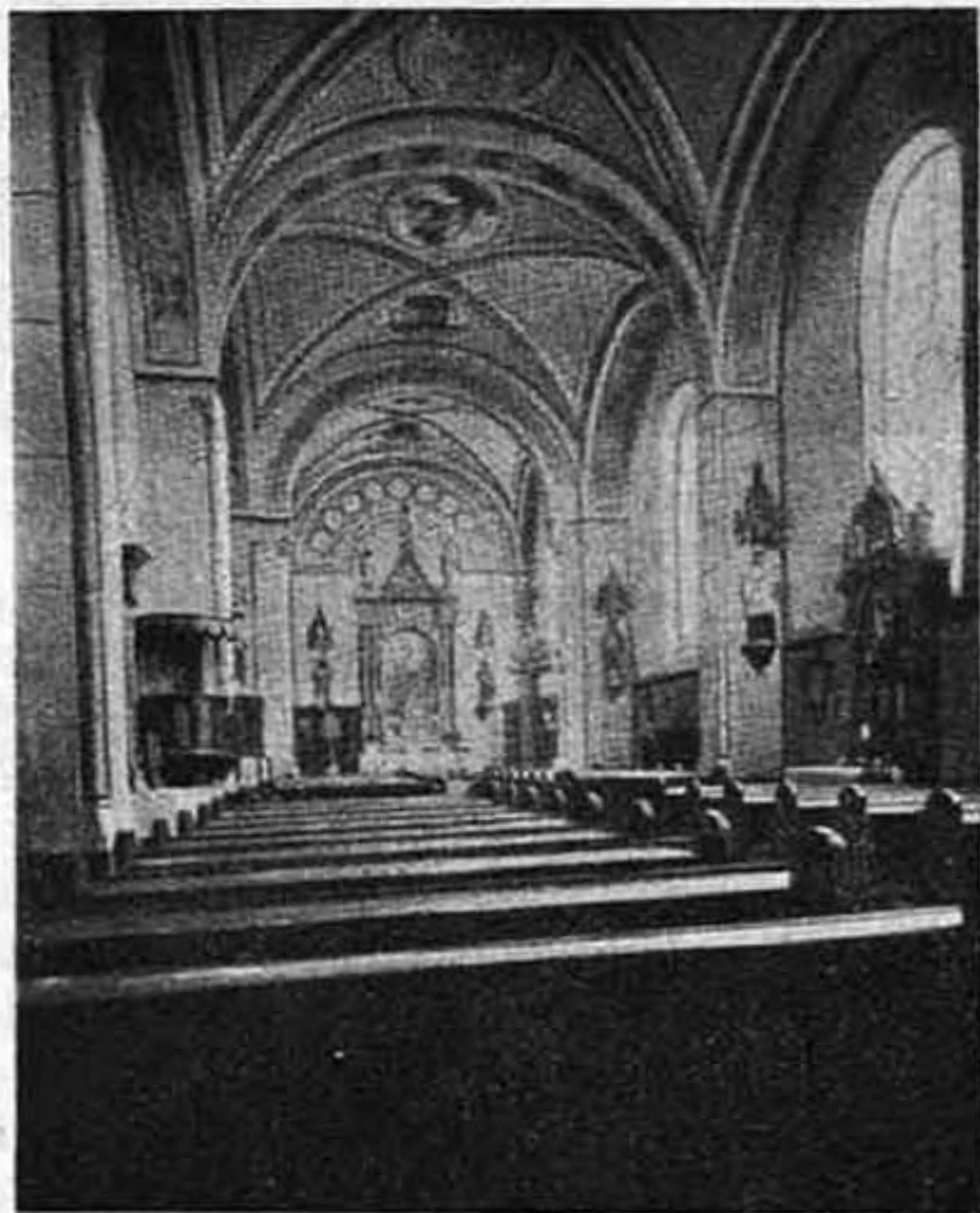
A Miasszonyunkról nevezett szerzetesnők kalocsai templomának beiseje.

vendve tapasztaltam, hogy e tekintetben nem akadt kifogásolni való. Figyelembe veendő még az a körülmény is, vajjon a munkák előállításánál számoltak-e a czélszerűségi szempontokkal. Például fehér selyem-oltárvánkos — volt ott ilyen is — magában véve bármily szép is, de nem igen praktikus, mivel hamarosan kopik meg piszkolódik. Legnagyobb értéke az egyházi ruhának és fehérneműeknek az, hogy minden darabon az oltáregyleti tagok maguk dolgoztak. Természetes, hogy önfeláldozó fáradozásba került az. Eleget mondtam azzal, ha fölemlítem, hogy a kalocsai egyesület közös munkadélutánjain állandóan 17 hölgy vett részt; még azonfölül otthon is sokat kellett dolgozniok a