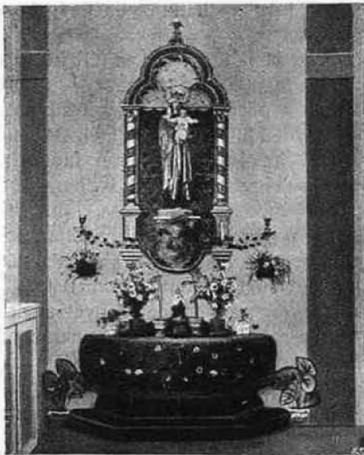
A Miasszonyunkról nevezett szerzetesnők intézetében a Mária-kongregációk által fölállított szobor Kalocsán.

Csanád egyházmegye 472 kor. 03 fill. Esztergom főegyházmegye 217 kor. Munkács egyházmegye 100 kor. Szepes egyházmegye 202 kor. 96 fill. Besztercebánya egyházmegye 50 kor. 70 fillér.