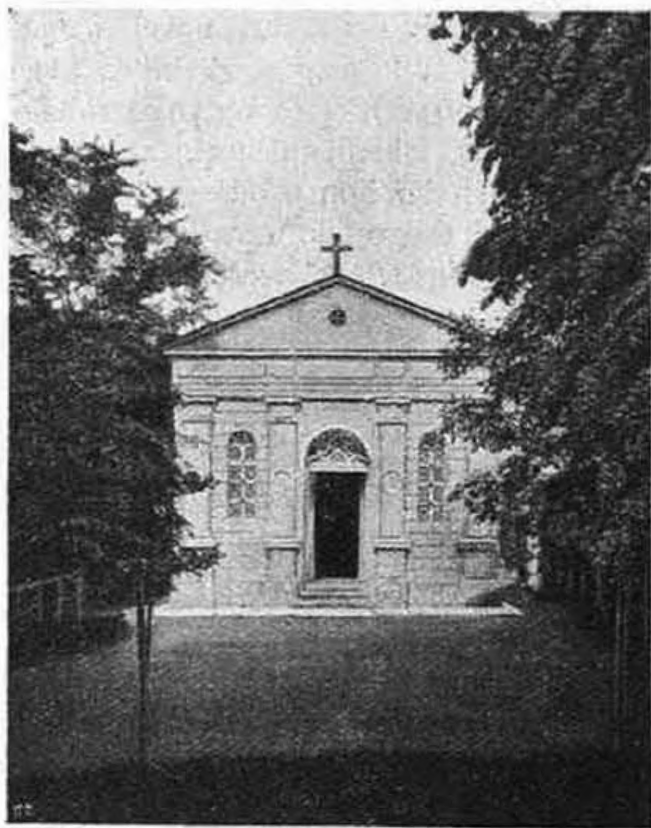
A Miasszonyunkról nevezett szerzetesnők kerti kápolnája Kalocsán.

sület, a szabadkai Oltáregyesület tagjai is. Ezuttal első ízben történt, hogy a kalocsai kiállításra résztvettek miseruhák és fehérneműekből álló kézimunkáikkal.