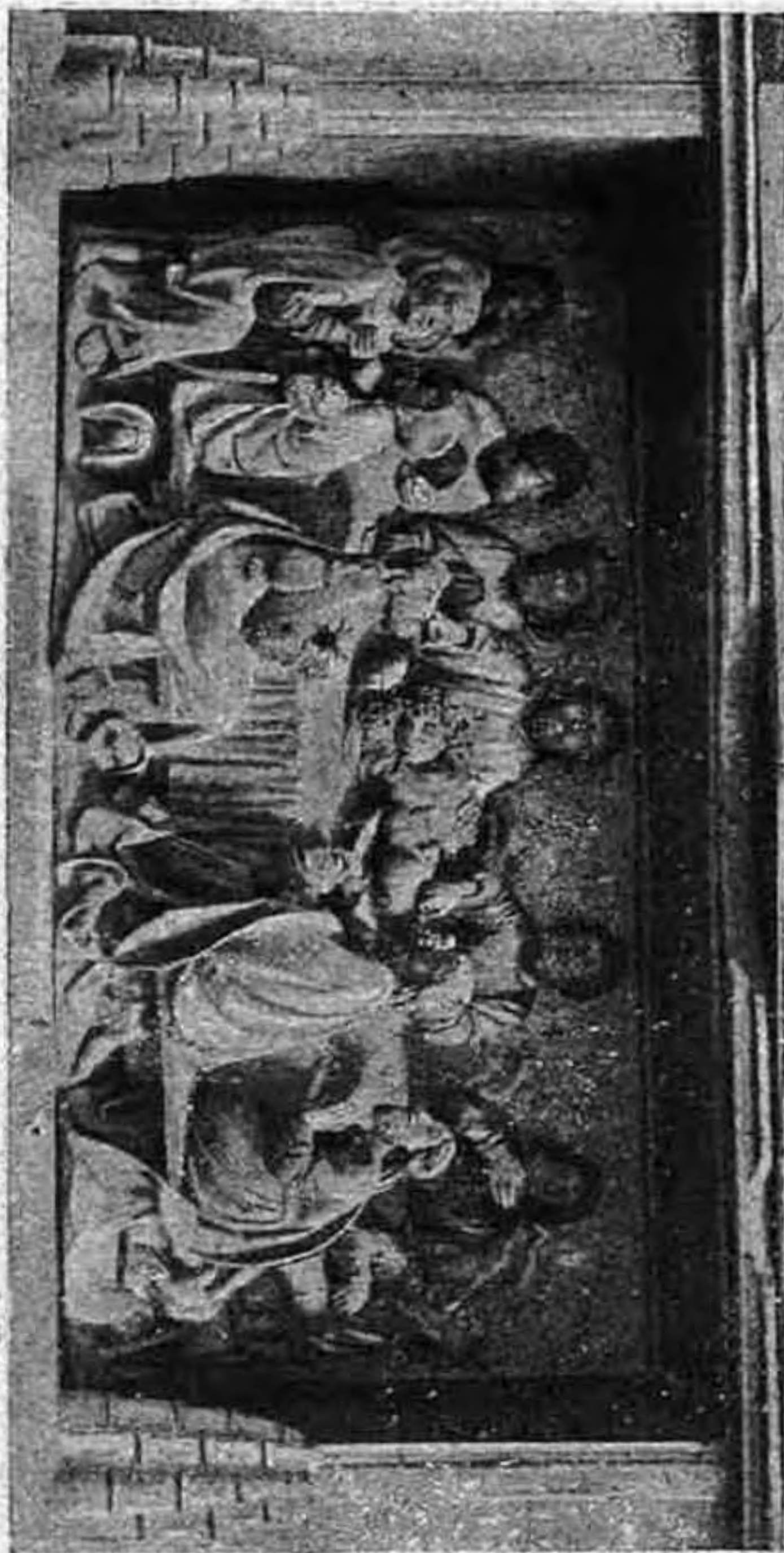
Az utolsó vacsora. — A szépszombati főoltár predellája. — Nyílásban 180 cm. széles. XVI. század.

A Passio képsorozatában ez az egyetlen festmény, a melynek korát bizvást a XIII. századba helyezhetjük. Az utolsó vacsorának ez a zsegrai kompozíciója Máté és szent János nyomán azt a fenséges mozzanatot ábrázolja, a midőn Jézus elárultatásáról nyilatkozik. Az