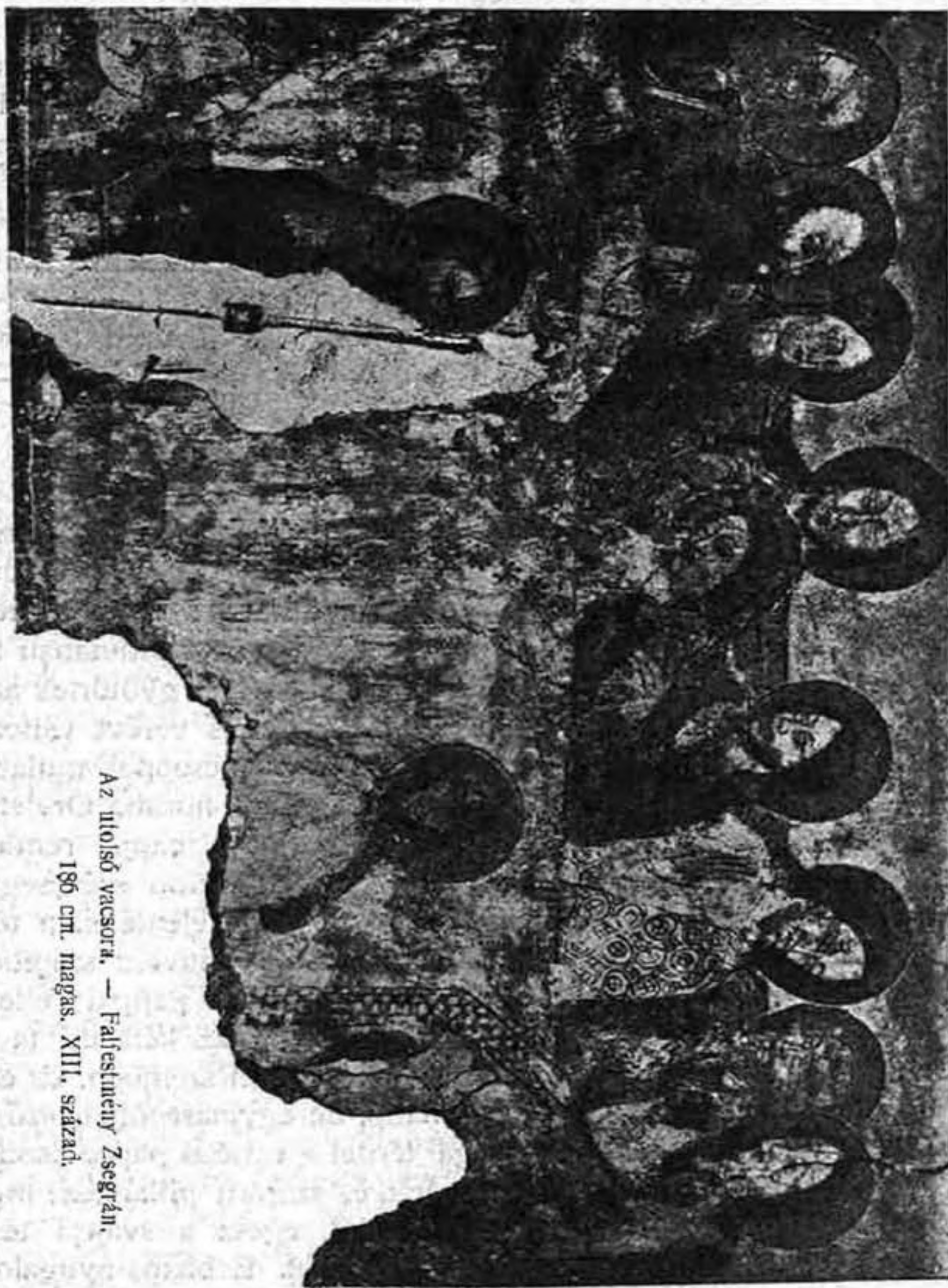
Az utolsó vacsora. — Falfestmény Zsegrán.

annyira szemökkel, mint isteni ihlet révén szereznek tudomást. A lelkesedés ez áramából, amint a szembenlevők öntudatos nyugalmán verődik vissza, támad a kép drámaisága, jóllehet csekély a külső cselekvénye. A szerkezet