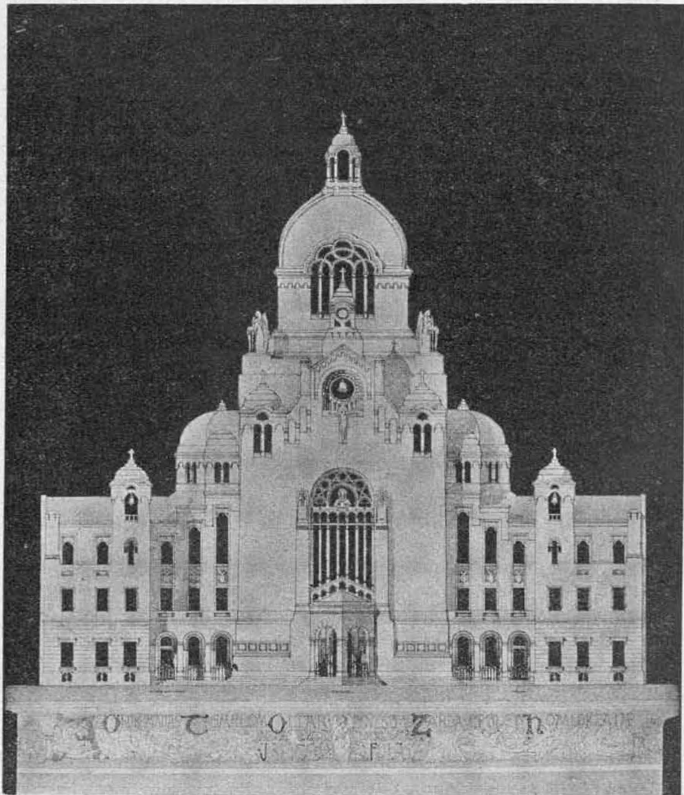
Az örökimádási templom «Fohász» jeligéjü pályaterve.

mit sem tehetnek, mi ellenben imáinkkal sokat tehetünk értük. Az isteni igazságosság megköti az isteni irgalmasság kezét, ez nem működhetik a