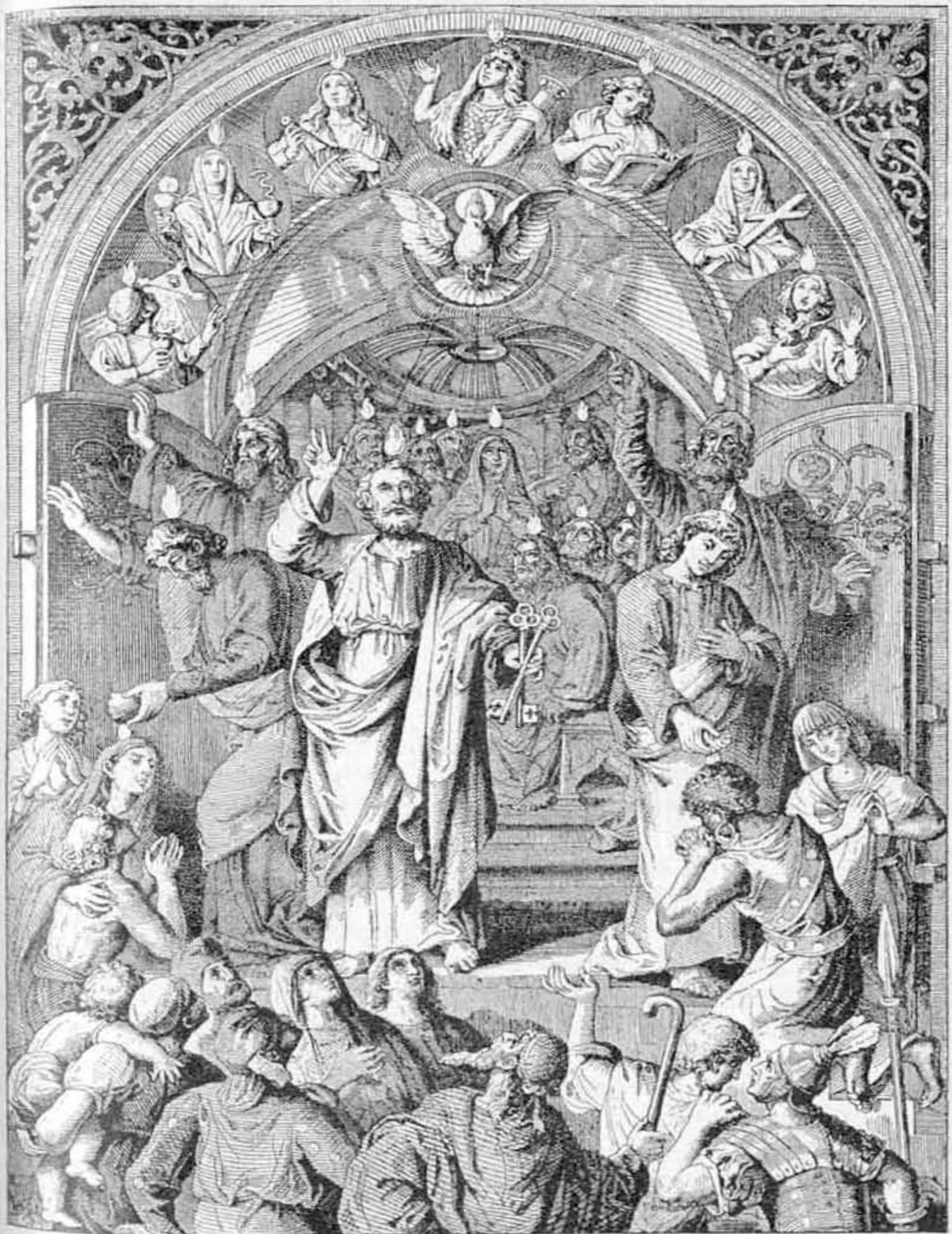
Az első Pünkösd.